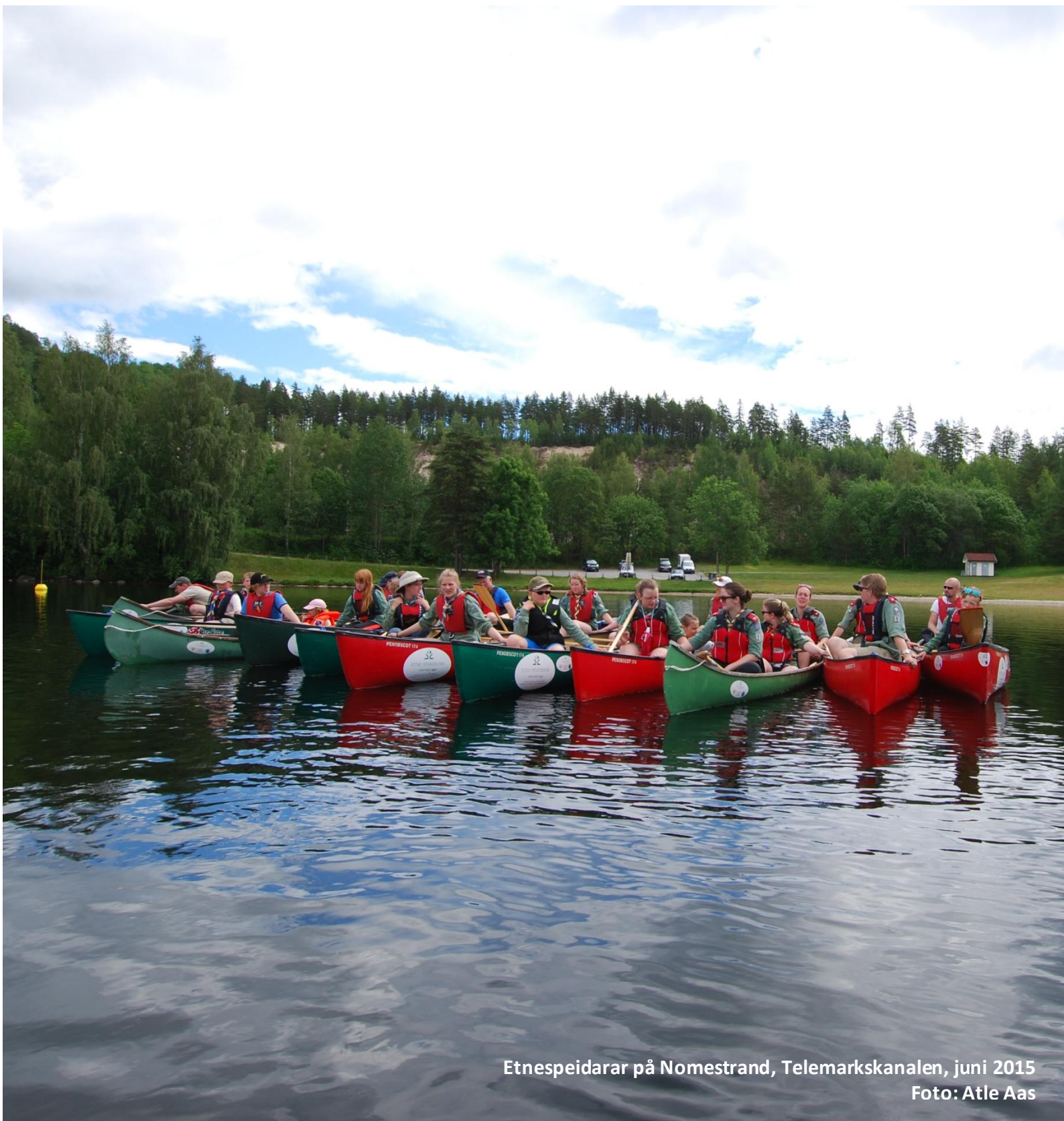
Etnespeidarar på Nomesstrand, Telemarkskanalen, juni 2015