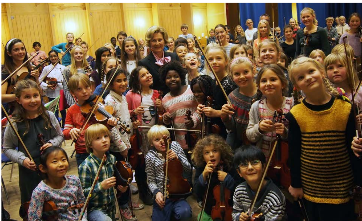
Unge orkestermusikere i Nordstrandshøgda strykeorkester og H.M. Dronningen 30. oktober 2014

For å nå de målene UNOF har, er det viktig og naturlig å samarbeide med andre. Forbundet har mange samarbeidspartnere, og søker ofte samarbeid for å få gjennomslag eller for å utvikle nye gode prosjekter. Denne perioden har forbundet styrket flere gamle samarbeid, og også fått en del nye.