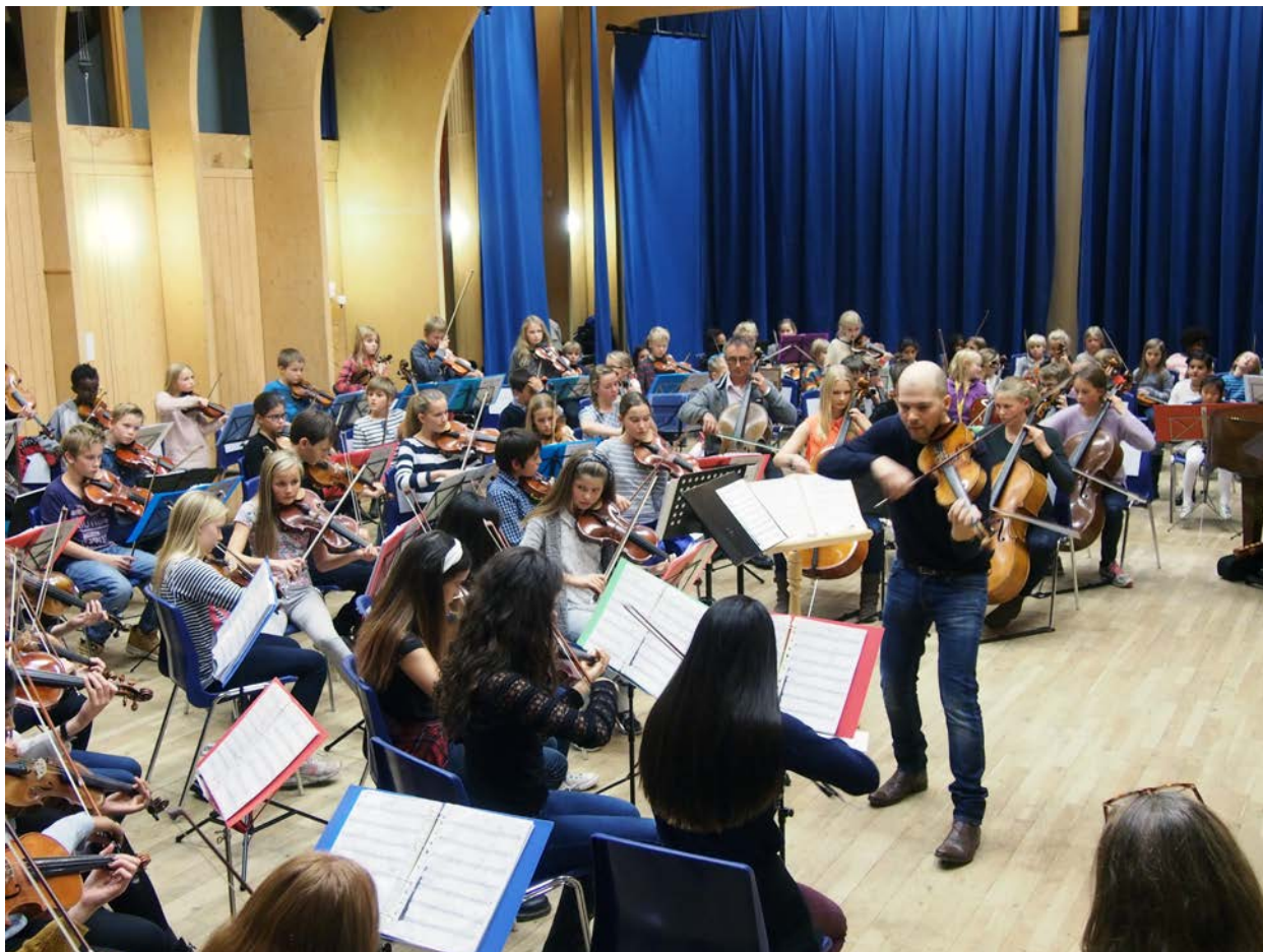
Samspill i orkester gir glede, kunnskap og venner.

UNOF søkte LNU om midler for å gjennomføre prosjektet “Distribuert landsfestival”, og fikk god støtte til dette. Festivalen ble gjennomført i uke 43, 2014. Prosjektet besto i å engasjere medlemmene til å arrangere flere konserter og markeringer rundt om i landet i samme uke. UNOF sentralt delte ut midler fra tilskuddsordningen til festivaler, orkestersamlinger ol. til dette. Disse arrangementene ble så knyttet sammen gjennom nettsidene og felles markedsføring. Et av arrangementene ble plukket ut til å satses ekstra på, i form av direkte-overføring på UNOFs nettsider. Konserten ble slik spredt til alle medlemmene og andre interesserte. Direktesendingen og opptaket fikk god oppmerksomhet.