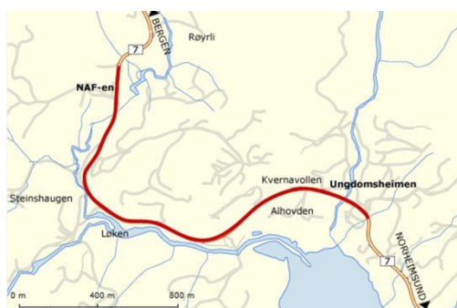
Figur 4 Skisse av Kvamskogen gang- og sykkel

Reguleringsplan for prosjektet er ferdig og godkjent. Det er per i dag ikkje midlar i Kvammapakken til å starte prosjektet.