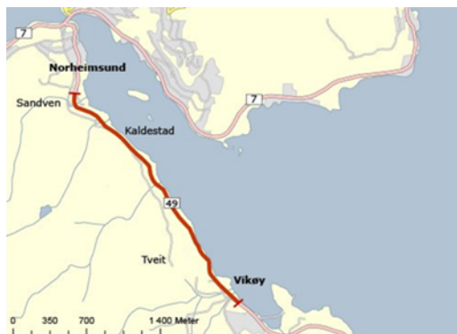
Figur 2 Skisse Norheimsund - Vikøy

Prosjektet er ferdig bygd, så nær som mindre tiltak i Vikøy. Det er per i dag ikkje midlar i Kvammapakken til å gjennomføre tiltak i Vikøy.