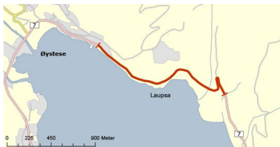
Figur 5 Skisse av Skarpasvingen – Øystese aust

Strekninga er delt i to planprosjekt på grunn av arkeologiske funn. Det er godkjent reguleringsplan for Laupsa – Øystese Aust. Det manglar reguleringsplan for Skarpasvingen. Det er per ikkje midlar i Kvammapakken til å gjennomføre heile tiltaket.