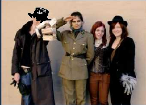
Cosplayere på Regncon