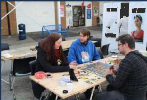
Styremedlemmer fra Hyperion Vest på foreningsbesøk i Lindås