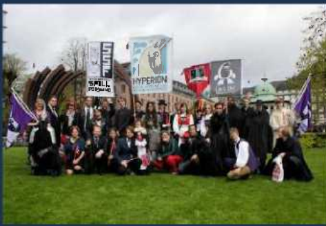
Gruppebilde fra 17. mai toget til Hyperion Vest