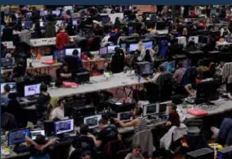
Deltakere på Hordalan Dataparty på Sotra Arena når styret var på besøk