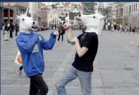
Styremedlemmer fra Hyperion Vest som promoterer organisasjonen på Torgallmenningen i Bergen