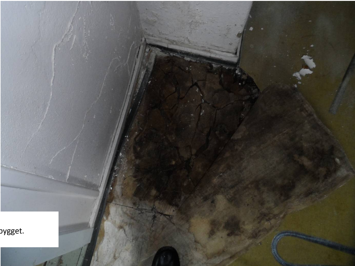
Vedlegg 2.1.3. Bilder Admin.bygget.