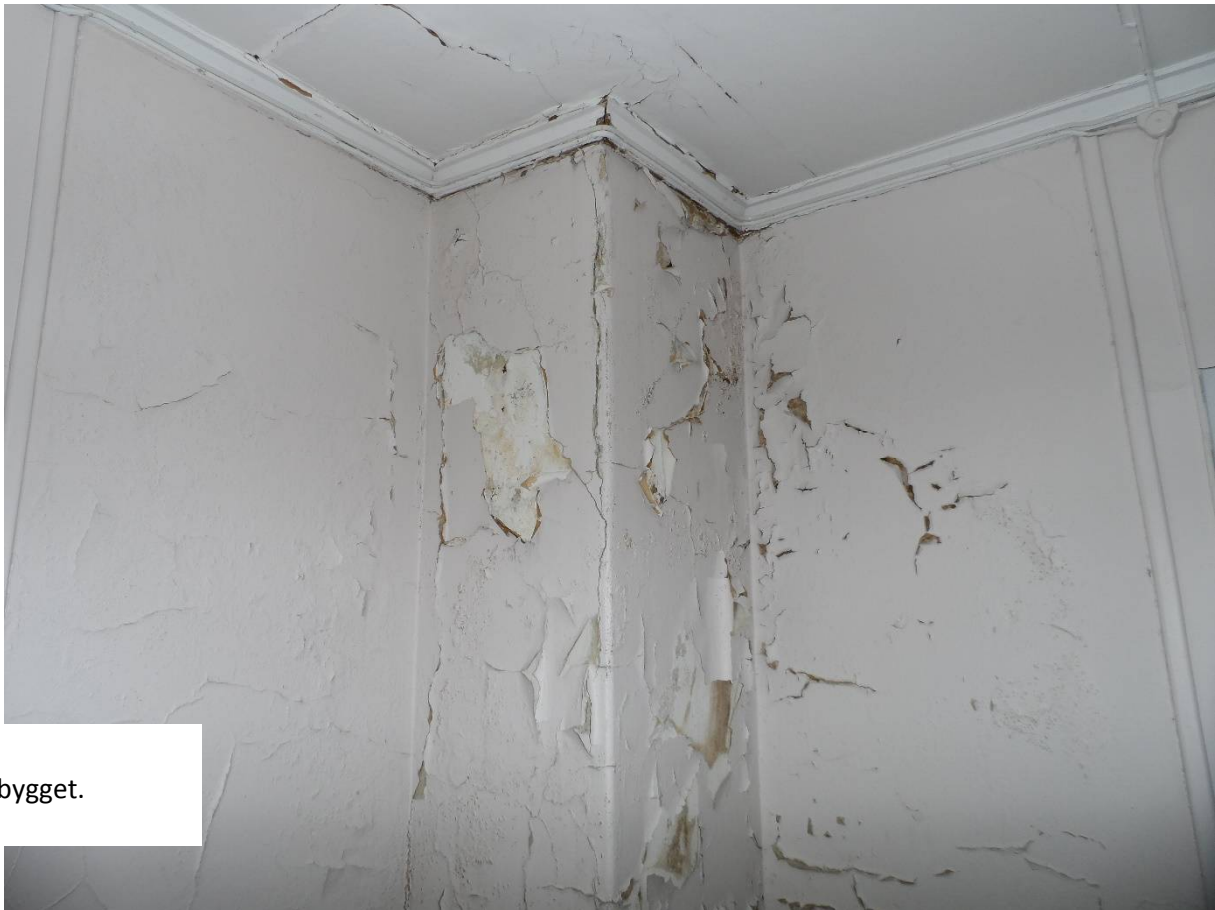
Vedlegg 2.1.2 Bilder Admin.bygget.