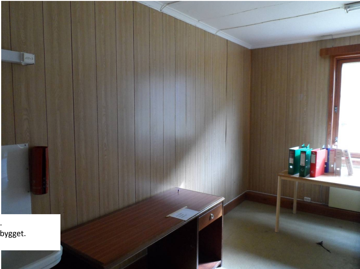
Vedlegg 2.1.6. Bilder Admin.bygget.