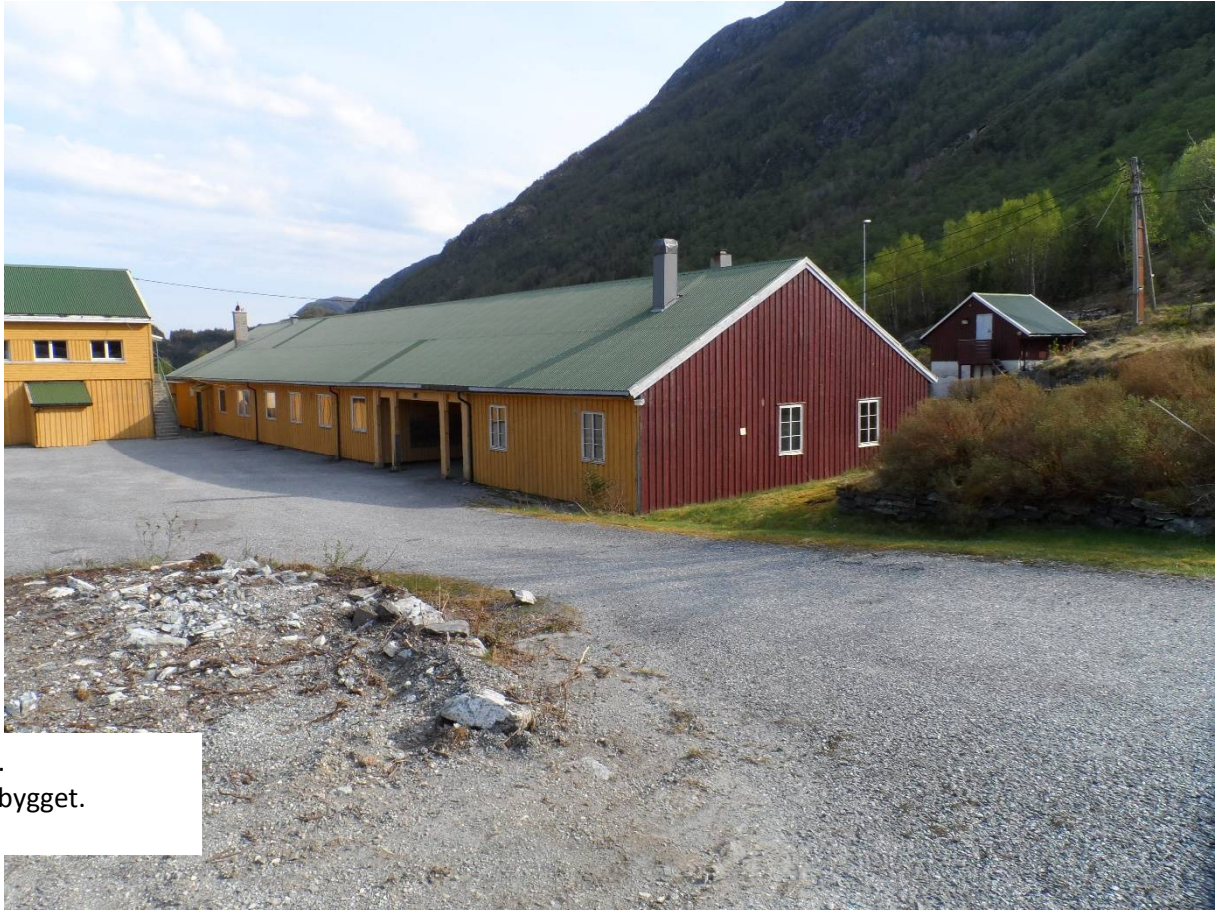
Vedlegg 2.1.5. Bilder Admin.bygget.