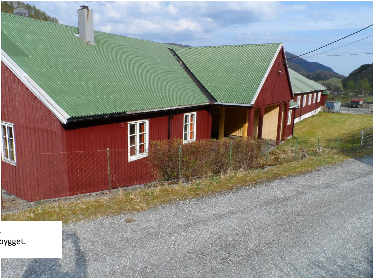
Vedlegg 2.1.7. Bilder Admin.bygget.