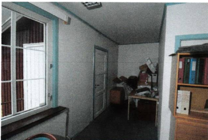
Kontor med antatt opprinnelig dør.