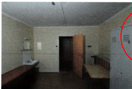
Forlegningsrom med 60-talls platedører.

Mest presserende tiltaksområder: Innvendige fuktskader, råte. Store deler av bygget er for øvrig i behov av omfattende istandsetting.