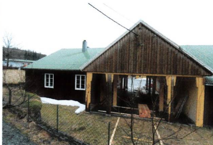
Hovedinngang med adkomst fra øst.