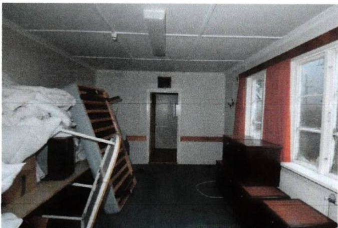
Forlegningsrom med antatt opprinnelige vinduer.