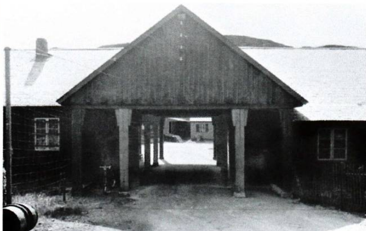
Adm.byggets gjennomkjøring under krigen.