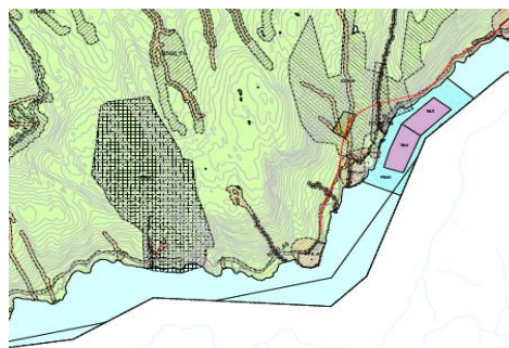
Figur 1 a og b: Endringsforslag i ny kommunedelplan. Akvakulturlokalitet ved Blom er fjerna, medan Skaftå er utvida.