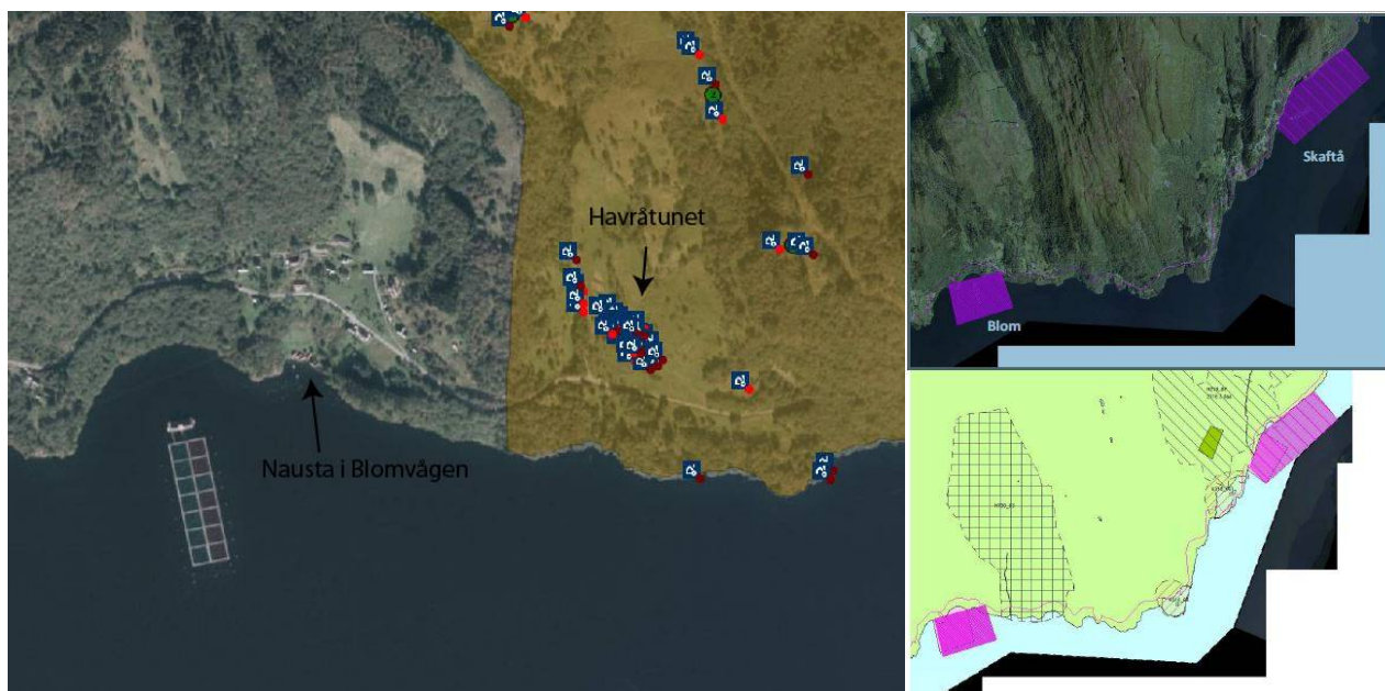
Figur 4. Freda kulturmiljø kulturmiljø på Havråtunet og naustmiljøet i Blomvågen og omtalt areal med akvakultur på Blom og Skaftå.

Vi vil i denne samanheng peike på at kulturmiljøfredinga på Havrå ikkje er teke med i oversikten over freda kulturminne. Vi ber om at dette vert retta opp.