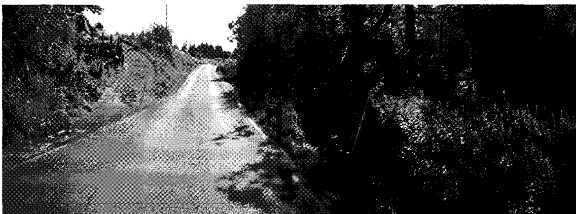
Vegbilete av avkøyrsla (2015).

Føremålet med svingradius er mellom anna å oppnå fartsreduksjon i avkøyrsla og oppnå eit ønska køyremønster ut på vegen. Denne avkøyrsla går på skrå og nærmast parallelt med fylkesvegen. Det optimale er at avkøyrsla skal ligge i 90 ° vinkel på vegbanen. Det vil i praksis seie at denne avkøyrsla ikkje har svingradius. I prinsippkissa har vi satt som krav svingradius på 4 meter. Krava vi har satt i prinsippkissa gjeld personbil. Dersom det skulle vere aktuelt med traktor og tømmertransport her vil krava til mellom anna svingradius verte skjerpa til 9 eller 12 meter.