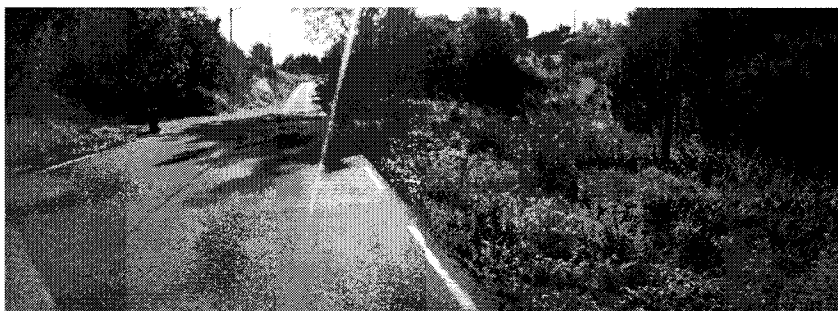
Vegbiletet av parkeringsplass (bak bosspann til venstre). Avkjørsla kan skimtast til venstre i biletet lenger framme på vegen (2015).

Vår merknad til dette er at parkering skjer utanfor vegbana, i eit område der vegbana er utvida, og er ikkje til hinder for trafikken. Etter ei samla vurdering finn vi at denne løysinga vil vere mindre trafikkfarleg enn å utvide bruken av den omsøkte avkjørsla.