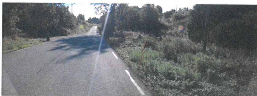
Vegbilette av parkeringsplass (bak bosspann til venstre). Avkjørsla kan skimtast til venstre i biletet lenger framme på vegen (2015).

Vår merknad til dette er at parkering skjer utanfor vegbana, i eit område der vegbana er utvida, og er ikkje til hinder for trafikken. Etter ei samla vurdering finn vi at denne løysinga vil vere mindre trafikkfarleg enn å utvide bruken av den omsøkte avkjørsla.