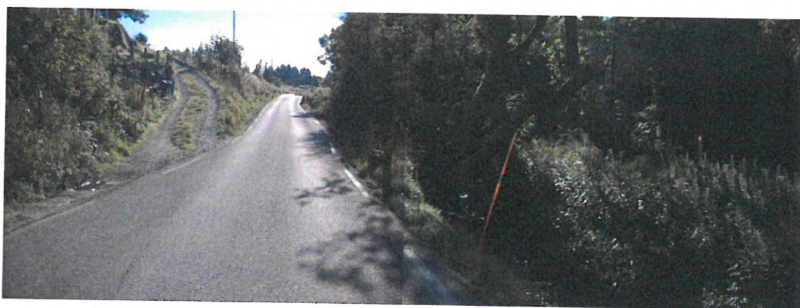
Vegbilete av avkøyrsla (2015).

Føremålet med svingradius er mellom anna å oppnå fartsreduksjon i avkøyrsla og oppnå eit ønska køyremønster ut på vegen. Denne avkøyrsla går på skrå og nærmast parallelt med fylkesvegen. Det optimale er at avkøyrsla skal ligge i 90° vinkel på vegbana. Det vil i praksis seie at denne avkøyrsla ikkje har svingradius. I prinsippsskissa har vi satt som krav svingradius på 4 meter. Krava vi har satt i prinsippsskissa gjeld personbil. Dersom det skulle vere aktuelt med traktor og tømmertransport her vil krava til mellom anna svingradius verte skjerpa til 9 eller 12 meter.