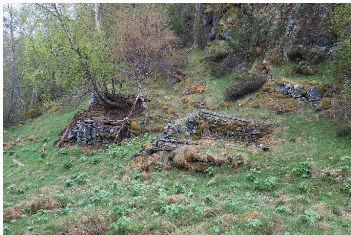
Tunet på Horten. Murar etter våningshuset (til venstre) og eit mindre hus.