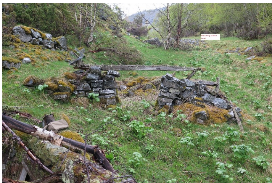
Markering av alternativ plassering utanfor tunet (øvt til høgre i bildet).