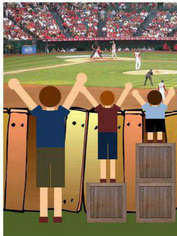
This is JUSTICE