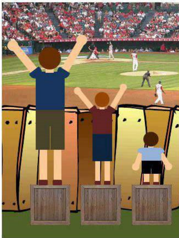
This is EQUALITY