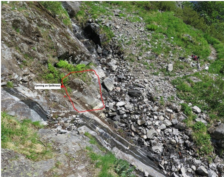
Merkt område for utbetring.

3. juni i år var forvaltar og SNO på synfaring saman med representant frå Voss utferdslag for å sjå på skadane på stien i bekken Skratla. Stien låg på ei hylle i bekkefare, men er rast ut slik at det berre er glatt fjell att. Det går årleg snøskred i dette området. Det vil vera trong for å fjerna fjellknausen i lengde på 3 til 5 meter, og med ei breidde på inntil 1 meter.