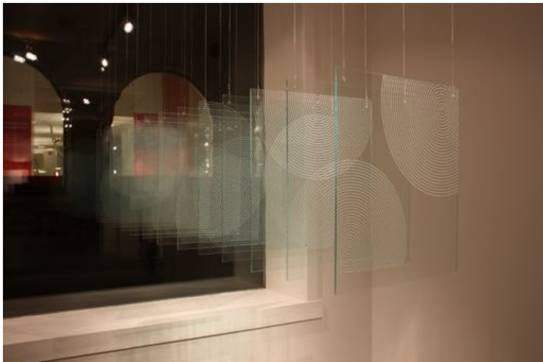
Beautifulfl flaws, 2013.

Oppholdet i Bergen kan regnes som et forstudie til en større utstilling som åpnet ved National Glass Centre, Sunderland, UK i 2013. Her spilte også drivhusglasset en sentral rolle i en større skulptur. Glassplater med små sandkorn/stein ble vasket og sendt til England etter forespørsel fra Sarmiento.