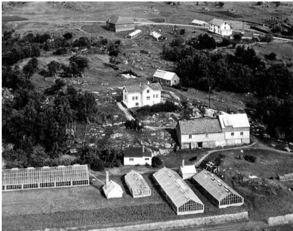
Meland kommune, Nordhordaland

- en oversikt over kunstprosjekter fra 2012-2016