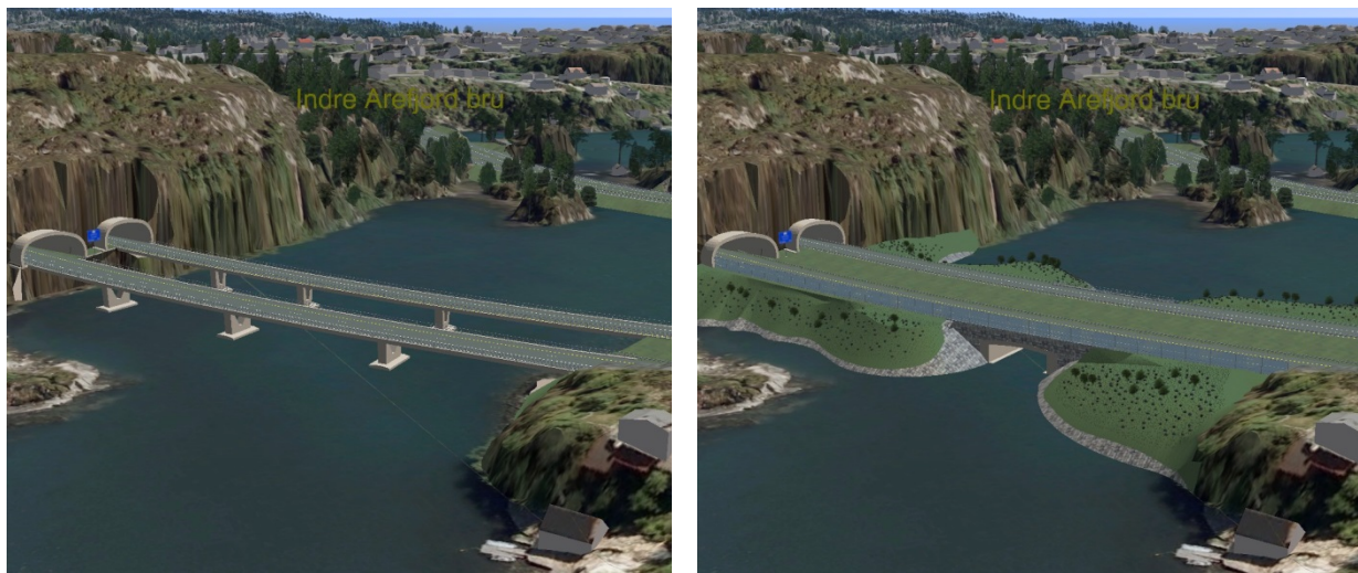
Ill: tidlegare og noverande framlegg til løysing i Arefjord.

Illustrasjonane nedanfor syner brua i Arefjord slik ho var planlagt opprinneleg (til venstre), og slik ho vil fremstå etter endringane i høyringsrunden (til høyre) om planen vert vedteken.