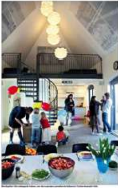
«Hvordan kan vi gjøre det slik at alle som kommer hit, skal ha en god opplevelse?»