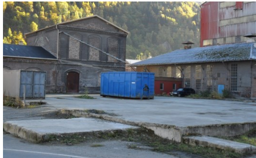
Foto tatt 16.10.15. Flaten containeren står på er fotavtrykk til revet bygning

Fra Odda kommunes gjeldende arealplan. Gjenstående bygning er angitt som vernet