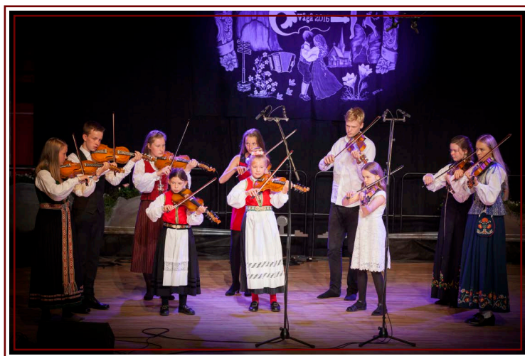
Bergen juniorspelemannslag i aksjon under Landskappleiken 2016, der dei vann sin klasse.