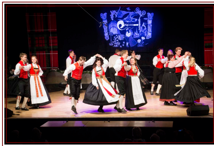
Hardanger Spelemannslag tevlar i lagdans under Landskappleiken 2016.

Formålet med ei satsing på folkedans i Hordaland er å leggja til rette for gode vekst- vilkår, auka interesse og forståing for tradisjonsdansen. Hovudprosjektet vil vera med å bidra til eit løft og bygga opp miljøa og aktiviteten i fylket. Det skal også bidra til å gjera folkedansen frå Hordaland meir synleg for innbyggjarane i fylket, men også på nasjonalt