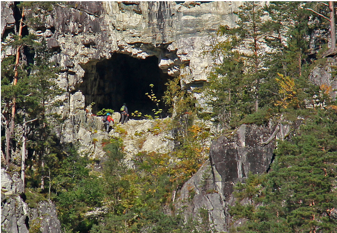
Jordalsnuten med «Drakeholet».