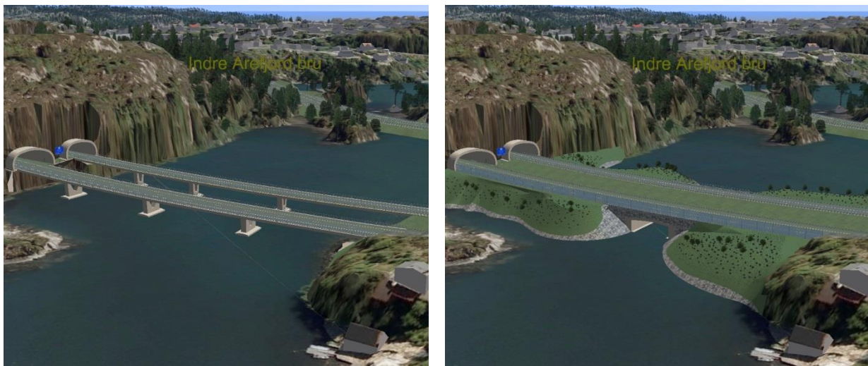
Ill: tidlegare og noverande framlegg til løysing i Arefjord.

Illustrasjonane nedanfor syner brua i Arefjord slik ho var planlagt opprinneleg (til venstre), og slik ho vil fremstå etter endringane i høyringsrunden (til høyre) om planen vert vedteken.