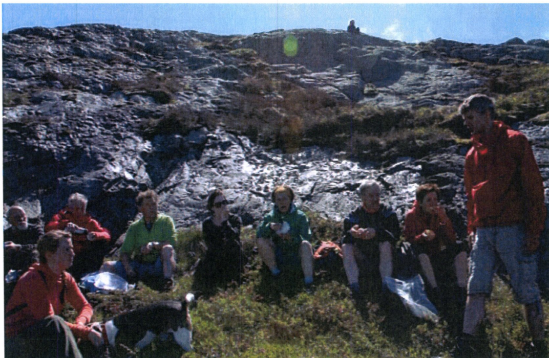
Ved ryolittbruddet på Siggjo 16.juni 2013