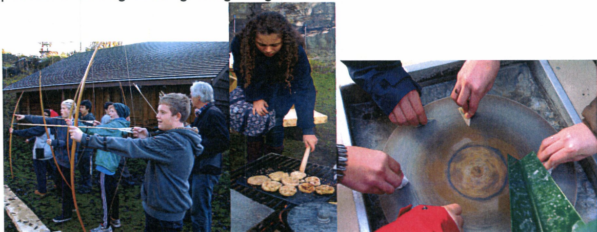
Aktivitetar i Mostratunet.

Bergverksutstillinga "Steinriket Bømlo" vart offisielt opna i samband med Mostraspelet i 2011. Utstillinga er eit flott supplement i tilbudet vårt og har blitt godt mottatt av publikum. I aktivitetsområdet Mostratunet har fleire skuleklassar også dette året gjennom tilbudet «Steinrike dagar i Moster Amfi» delteke i aktivitetar som bogeskyting, steinsliping, matlaging på steinaldervis og i tillegg fått kunnskap om reiskap i steinalderen og arkeologisk utgraving.