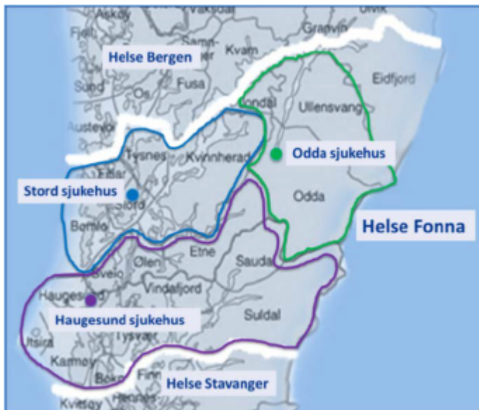
Figur 4. Sjukehusområdet i Helse Fonna

Prosjektrapporten omtalar ulike karakteristika ved sjukehuset. Stord sjukehus er eit akuttsjukehus som skal gje eit tilbod til dei store pasientgruppene i området. Det er medisinske og kirurgisk sengepostar og poliklinikkar ved sjukehuset i tillegg til operasjonsavdeling med fire operasjonsstover. Sjukehuset dekkjer ein befolkning på 49 000 som er forventa å stige til 56000 i 2030, og då særleg innan gruppa eldre. Kommunane i Sunnhordland har i dag fleire akuttinnleggingar enn vanleg gjennomsnitt pr. 1000 innbyggjarar.