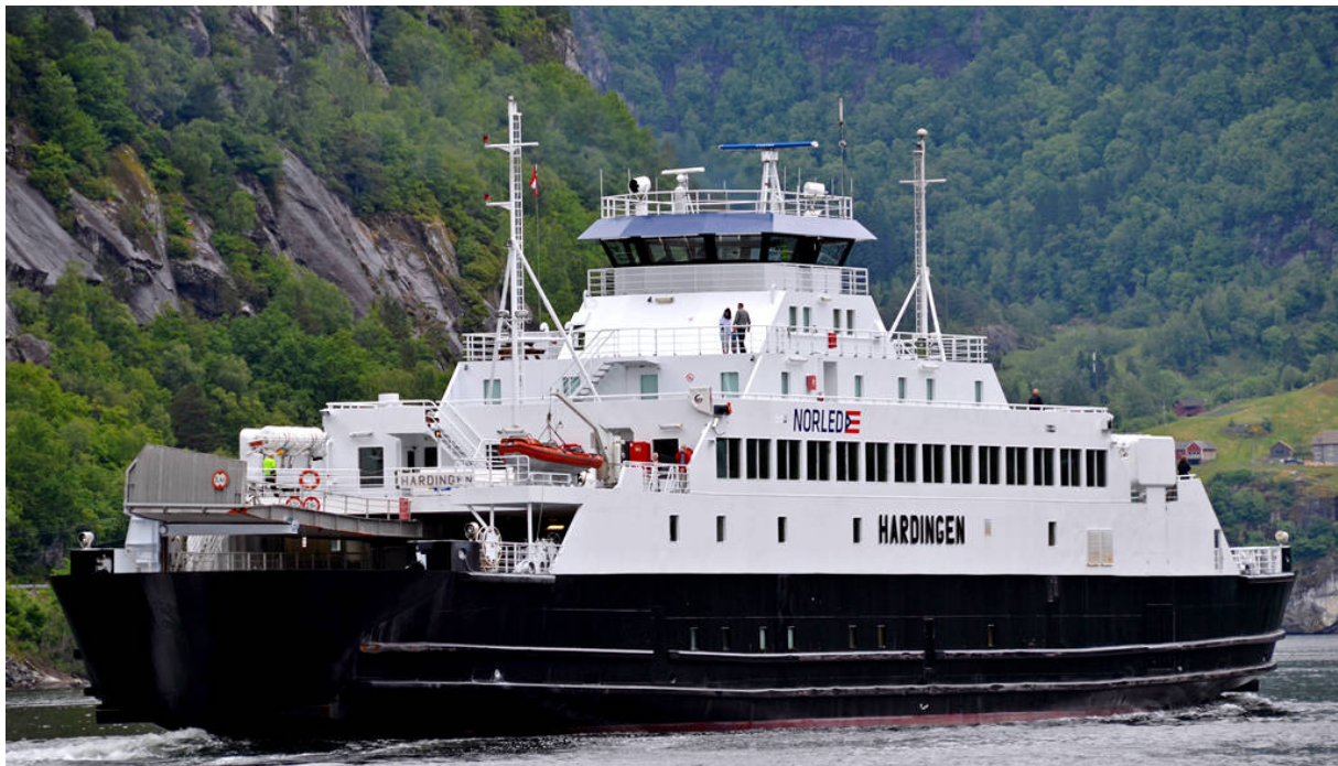
M/F Hardingen gjekk ut av trafikk i Hardanger i 2015.

Ferja Hardingen vart bygd i 1966 og gjekk i skyss for HSD fram til 1991. Då vart den seld til eit italiensk rederi. I 2016 vart den kjøpt att av Fjord2 og siglar no i norsk farvatn med norsk flagg. Velkomen heim!