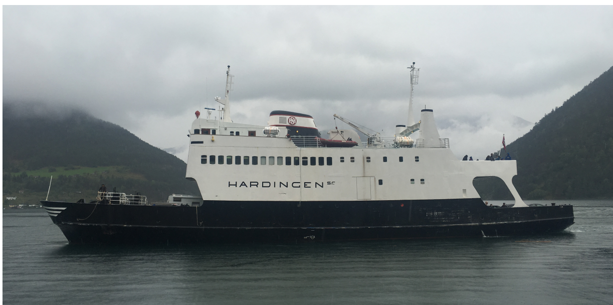
M/F Hardingen sr er komen heim.