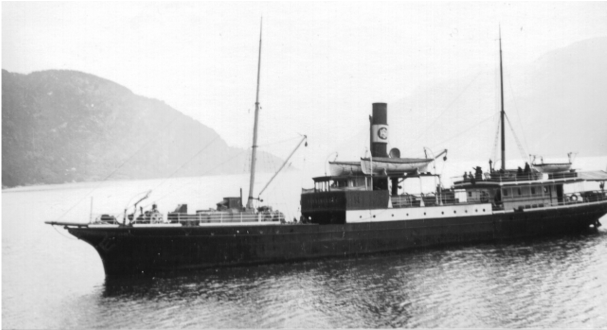
Hardanger og Voss Museum

D/S Hardangeren frå 1869, året kor saga starta. Foto: Anders P. Wallevik /Hardanger og Voss Museum