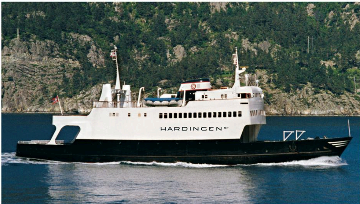
M/F Hardingen sr – sentrum og arena for aktivitetar under HardingTokt 2017

M/F Hardingen har sigla si siste rute og har mønstra av rutetabellane i Hardanger. Samstundes kjem M/F Hardingen sr attende til Noreg etter 25 år i eksil. Statens Vegvesen v/Nasjonale turistvegar etterlyser meir satsing på ferja i reiselivssatsinga i Hardanger. Ei kraftfull prosjektgruppe ynskjer å manifestera ferja som ikonisk farty på fjorden gjennom ei tokt på fleire dagar med aktivitetar og arrangement om bord for fleire målgrupper. Til sist skal toktet enda i Vågen i Bergen med eit storslege tingingsverk med ferja som instrument som skal udøyeleggjera ferja.