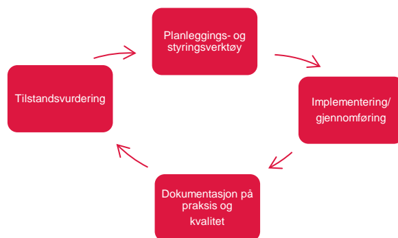
Figur: kvalitetssikring som ein syklus

Planleggings- og styringsverktøy definerer m.a. innhald og framdrift i fagskuleutdanningane. Dei mest sentrale dokument er her a) Fagplan (plan for utdanninga sitt faglege innhald og b) Plan for gjennomføringa av utdanninga (tid/stad). Andre dokument som kan ha betyding for fagskuleutdanning er nasjonale og regionale strategiplanar samt utviklingsplanar for den enkelte skule.