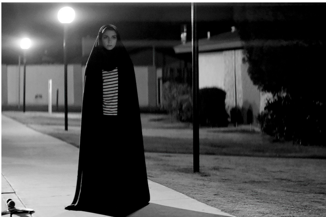
Fra filmen A Girl Walks Home Alone at Night

Konseptet med Double Bill ble viderført i 2015. Double Bill er en Hollywood-idé der publikum får to filmer for prisen av en - altså en helaftens kinoopplevelse. Man setter opp to filmer som til en viss grad hører sammen, eller belyser hverandre og tematikken på en forsterkende måte. I løpet av 2015 ble det arrangert to Double Bills. Den første utgaven var to filmer i genren "Rape-Revenge". Ingmar Bergmans Jomfrukilden (1959) var den direkte inspirasjonen til Wes Cravens The Last House on the Left (1972), to filmer som begge handler om hvordan "normale" familiefedre også tyr til vold når de får tak i gjerningsmennene som har voldtatt og drept deres datter. Den andre Double Billen var av en mye hyggeligere type: Tilbake til fremtiden (1985) og Tilbake til fremtiden II (1989). I sistnevnte film reiser hovedrolleinnehaverne til 21. oktober 2015, så det var klart vi måtte sette opp begge filmene i den anledning.