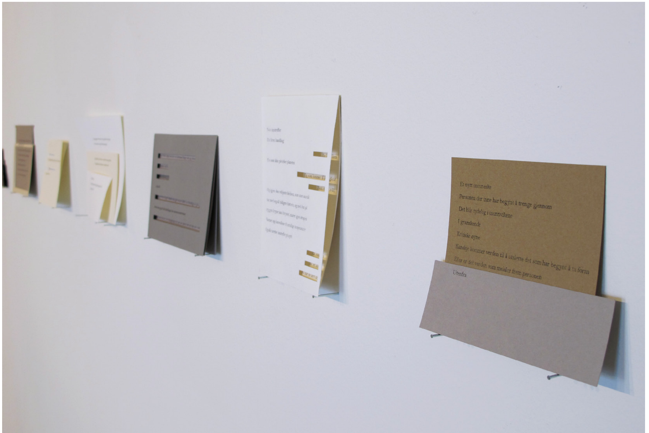
Ascent , diktcollage.