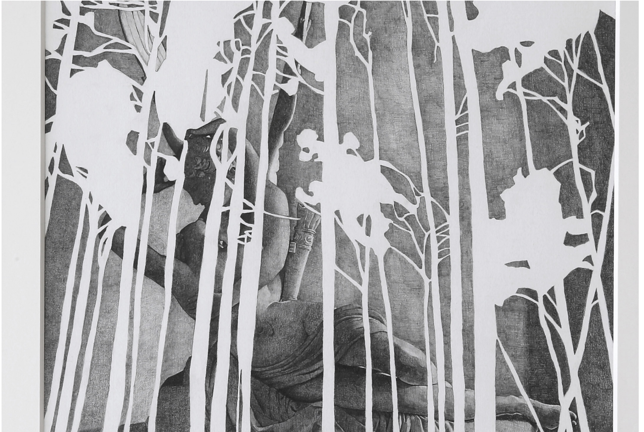
A Golden Ass , detalj.