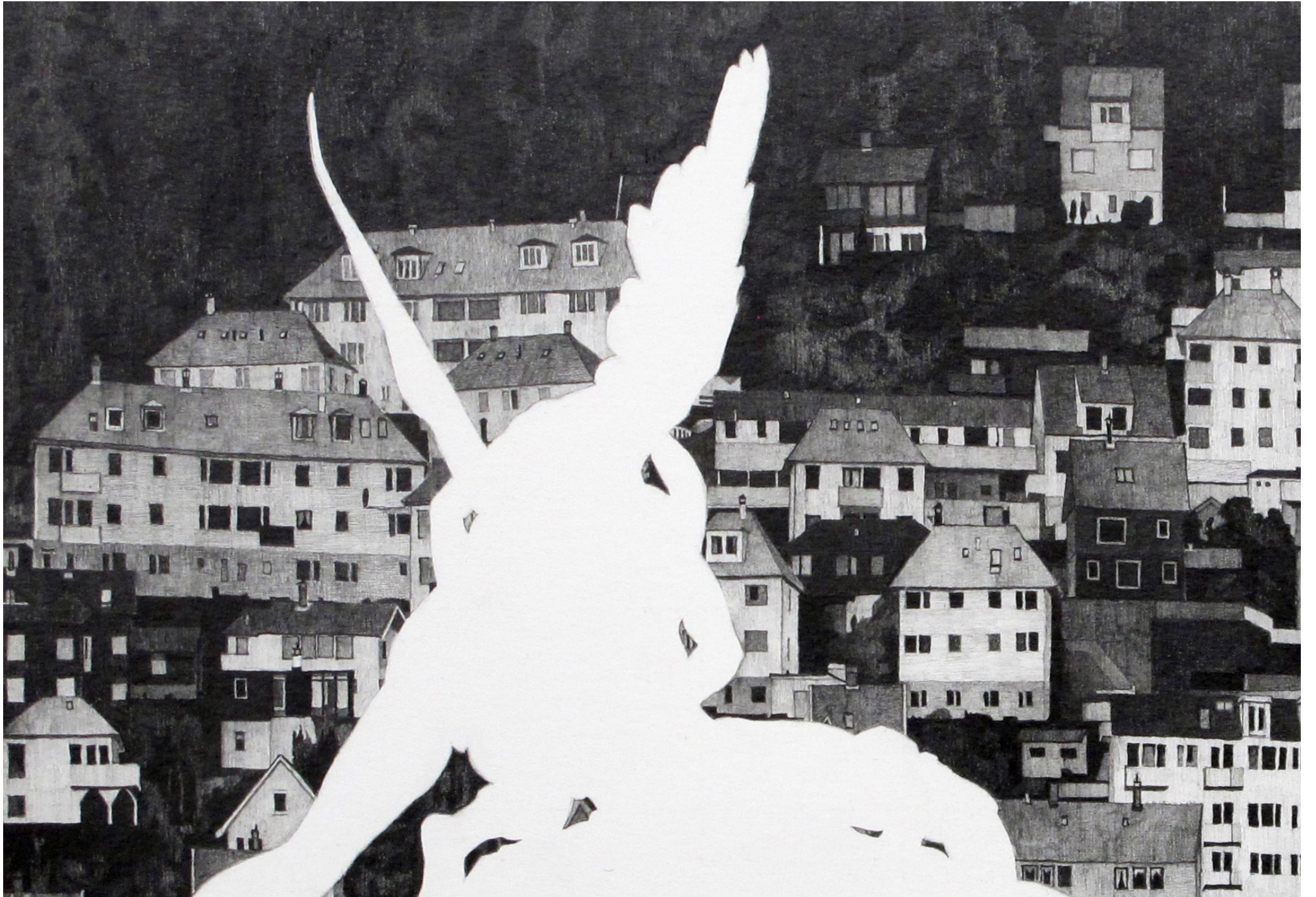
Give Me The Evidence That I Belong To Heaven, detalj.