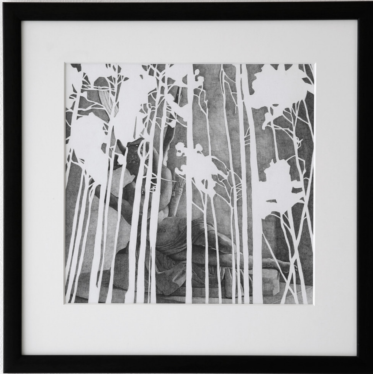
A Golden Ass , 2016, blyant på papir. 46x46 cm.