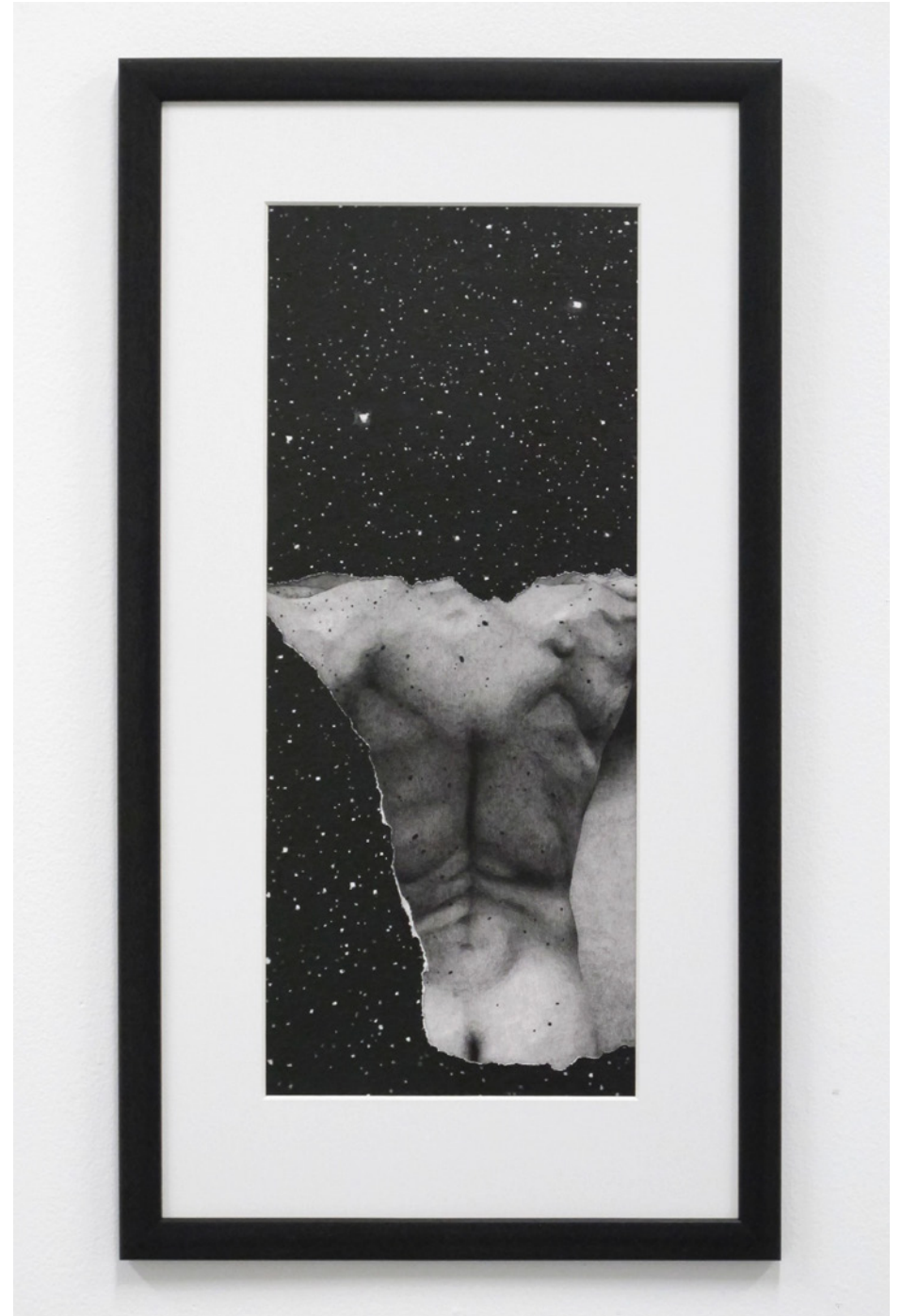
Cord Across The Void , 2016, blyant på papir, 62x32 cm.