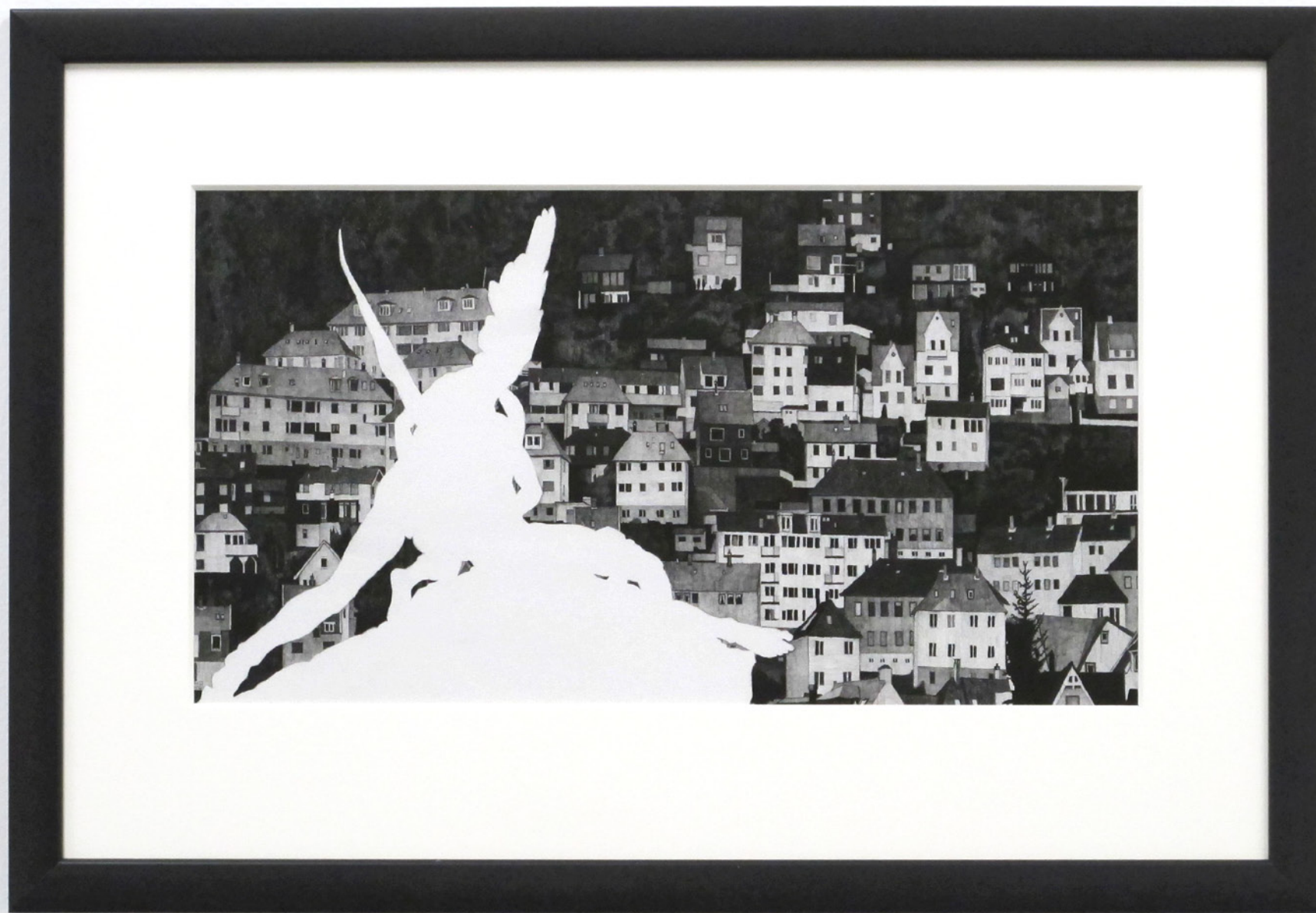
Give Me The Evidence That I Belong To Heaven , 2016, blyant på papir. 34x57 cm.