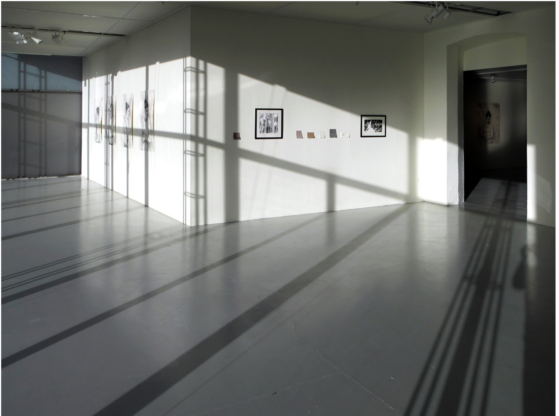
Ascent , med Filippa Barkman. Visningsrommet USF, april 2016.