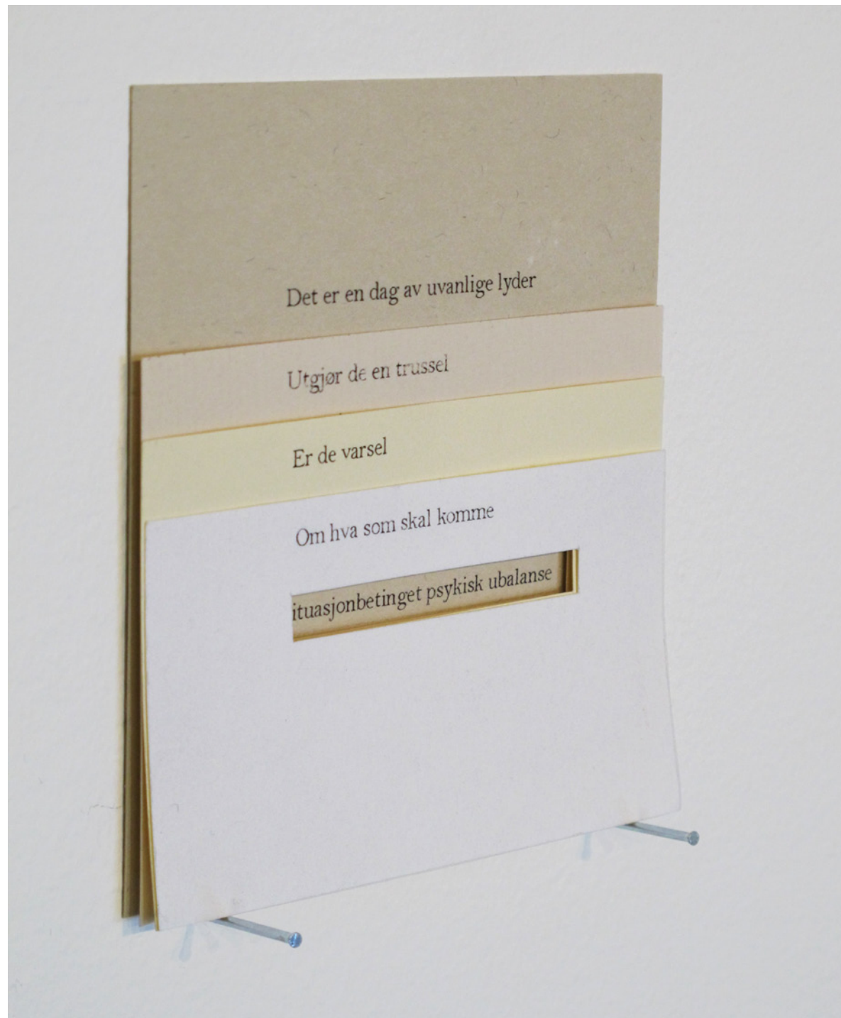
Ascent , diktcollage.