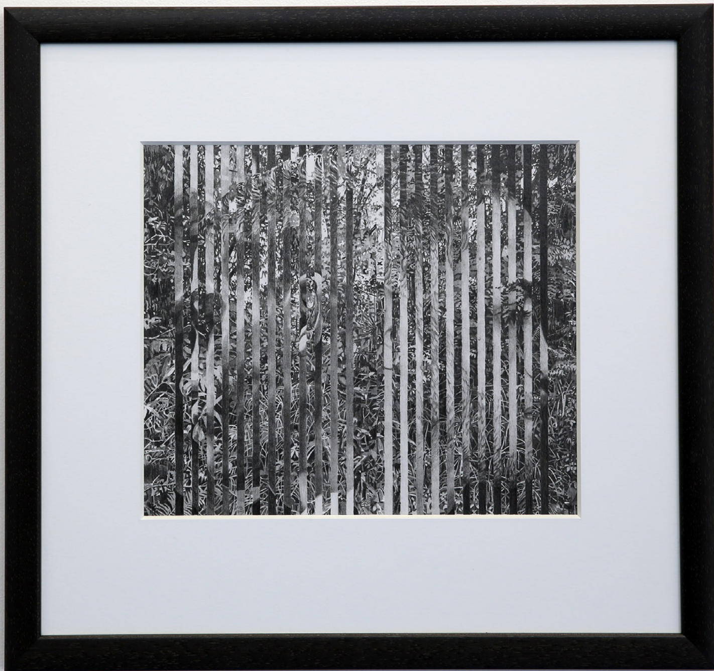
Wetlands , 2015, blyant på papir