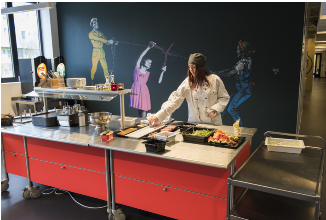
Hyssingen Produksjonsskule i Bergen