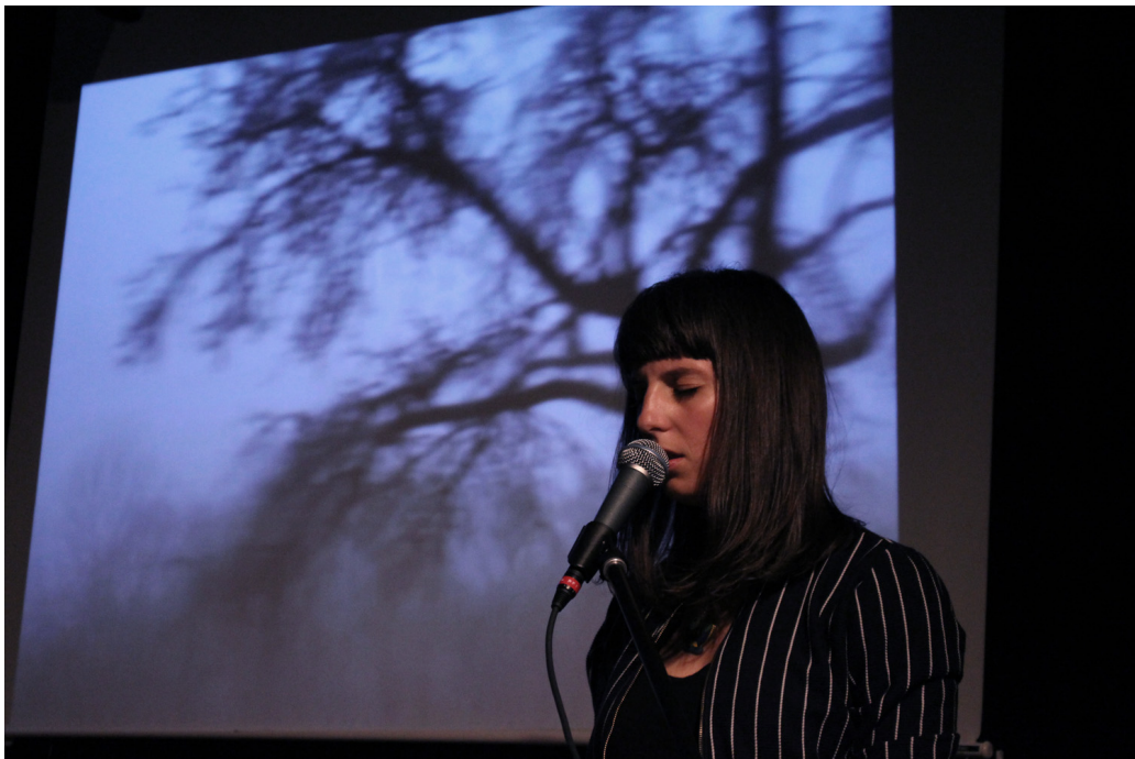
By The Waterhole - live i Tokyo