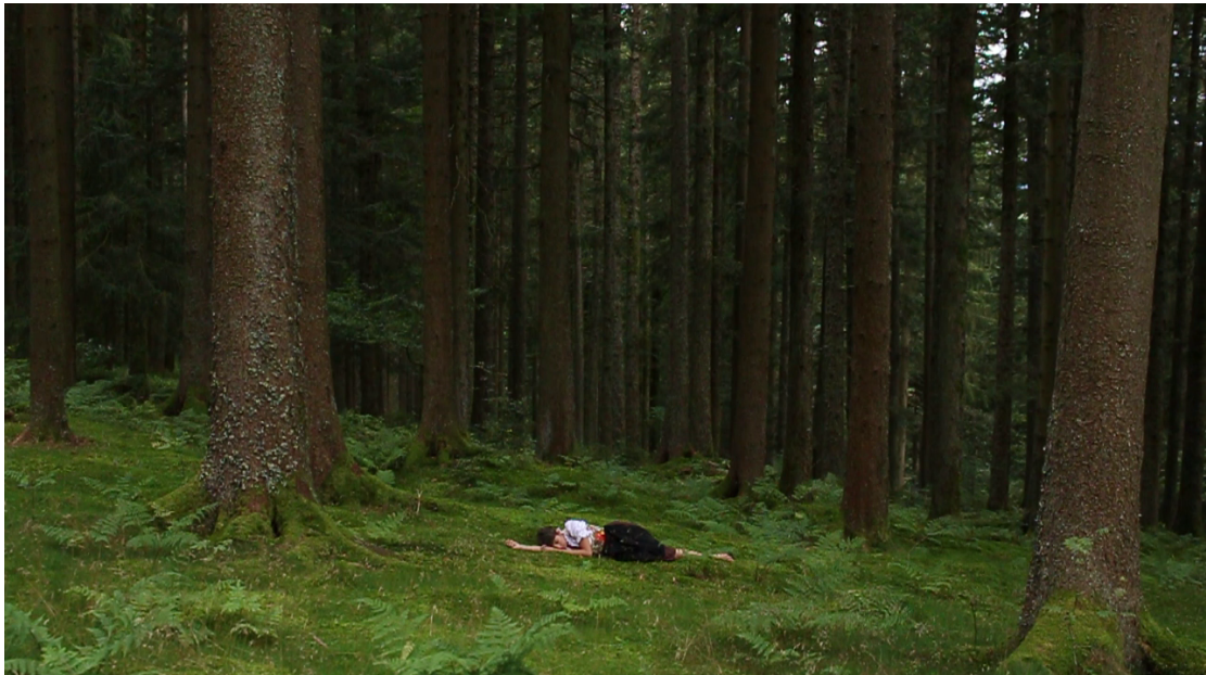
video still fra forprosjektet

Med utgangspunkt i mine personlige erfaringer vil jeg lage en forestilling om forskjeller og likheter mellom folk, nasjoner, tradisjoner og kulturer innenfor den samme kulturkretsen.