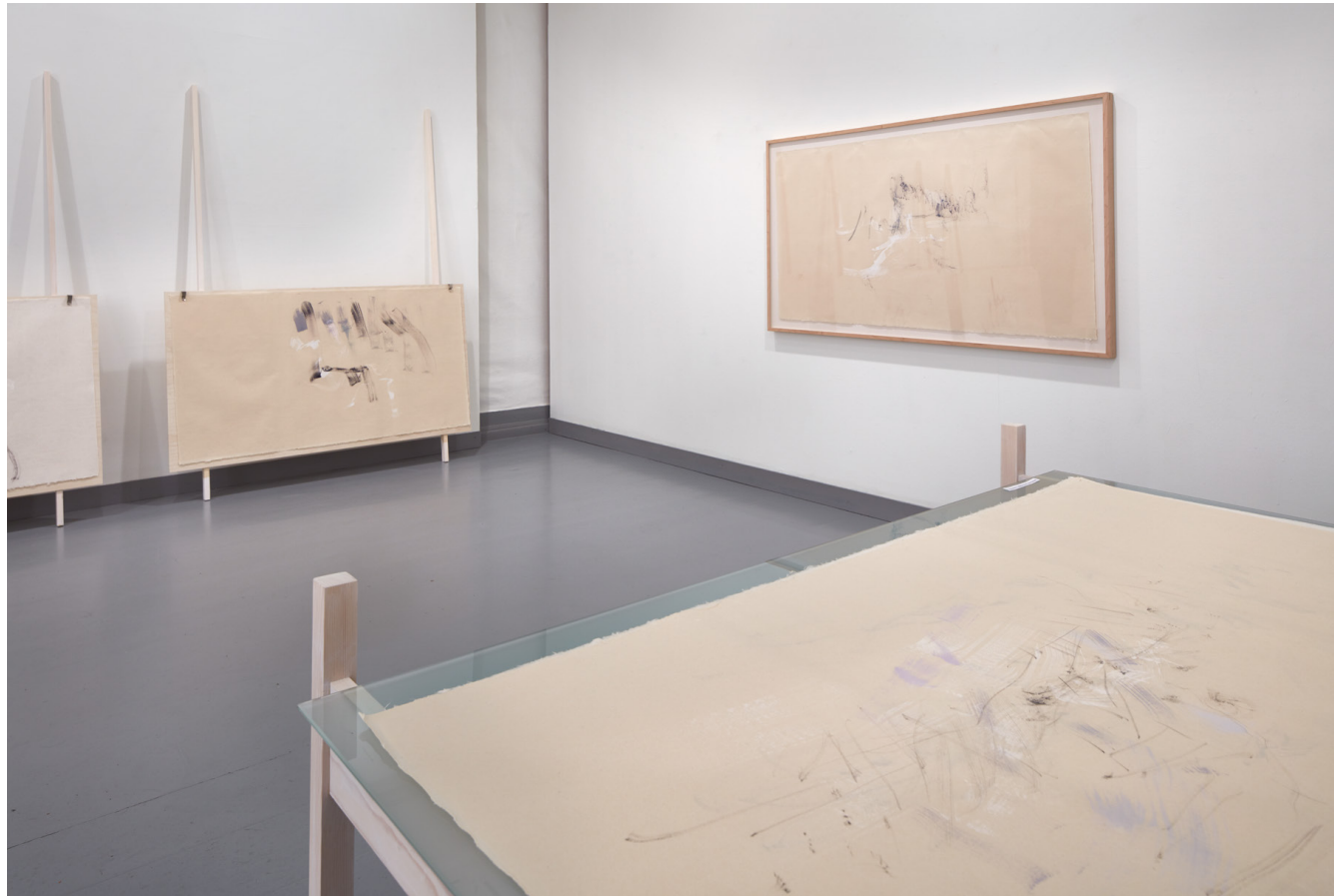
Stølen : Penseltegning /olje på Seichosen Mitsumata Rom 2