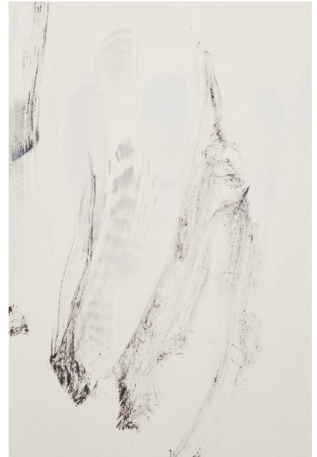
Laurisilva III (Detaljer)