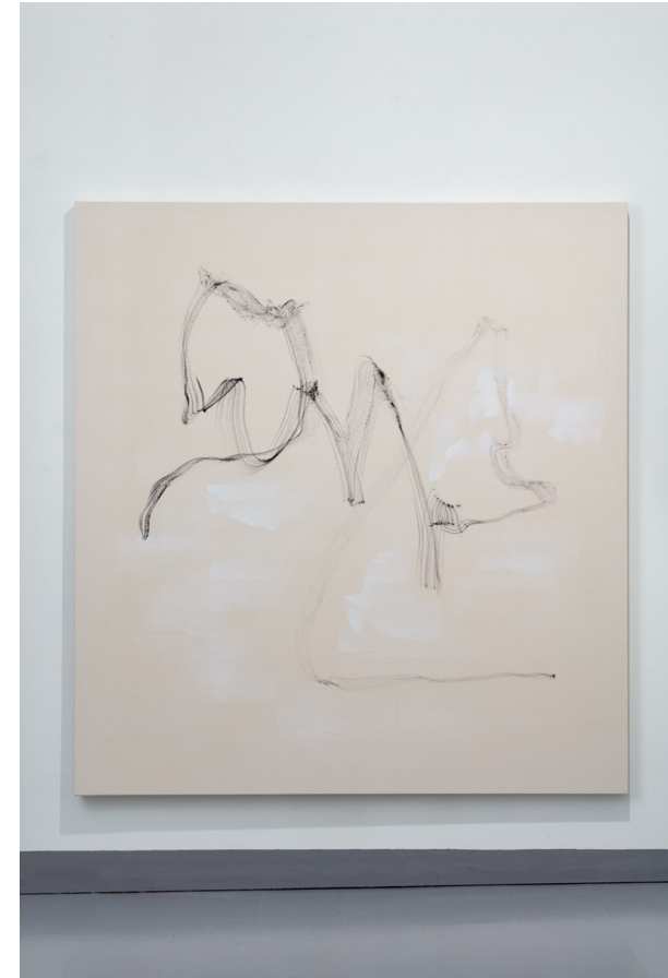
Installasjon med to bord og maleri. 150 cm x 140 cm. Gesso/olje på bomullslerret. Laurisilva: Against Snow, a Tall Beautiful Being... (Rimbaud)