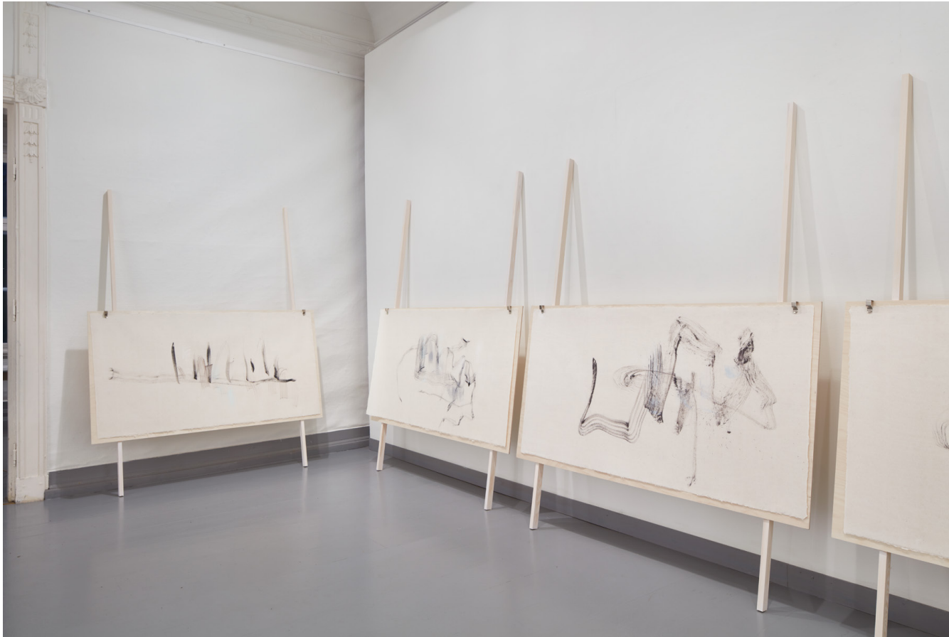
Laurisilva : Penseltegning /olje på Seichosen Kozo 73cm x 140cm. Montert på bjørkeplater.