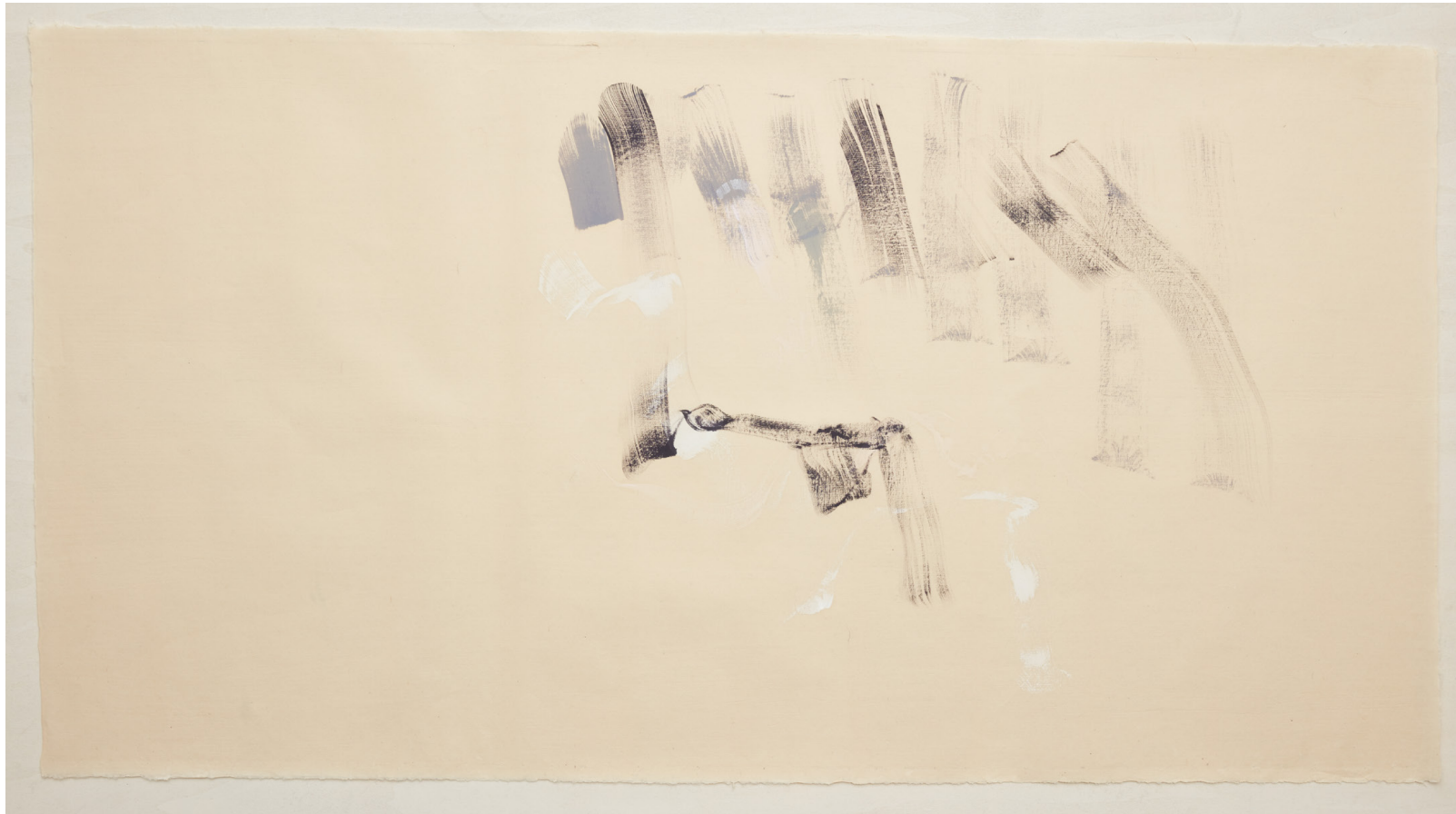
WANDERINGS Stølen mot vest . Penseltegning/olje på Seichosen Mitsumata 73 cm x 140 cm