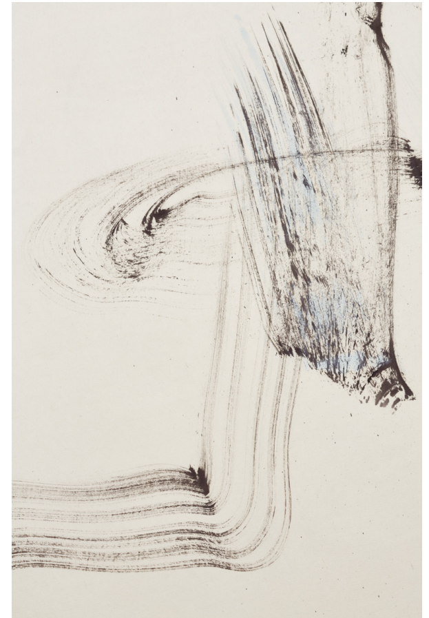
Laurisilva I (Detaljer)