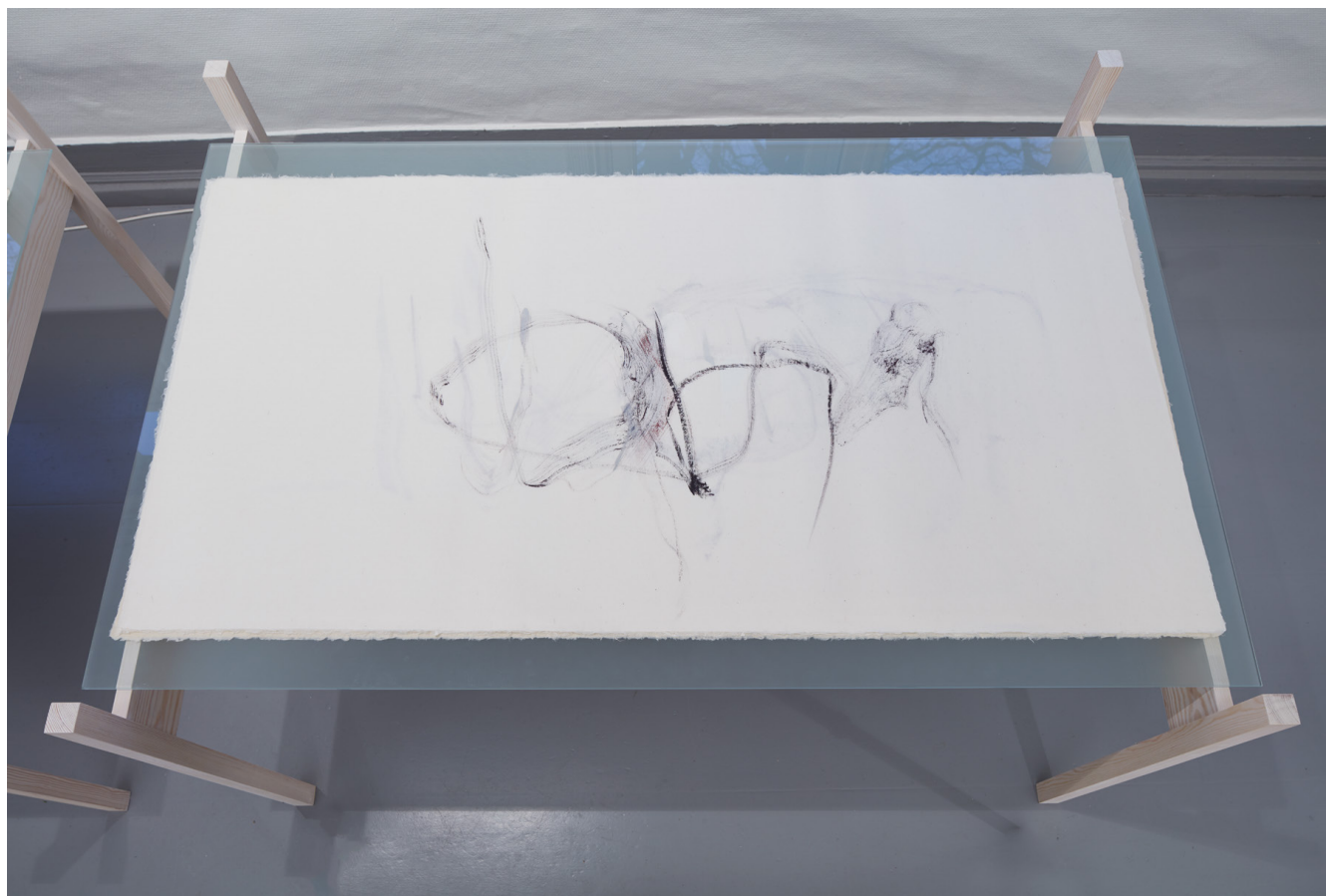
Laurisilva : Ovenfra – Betrakterens perspektiv.