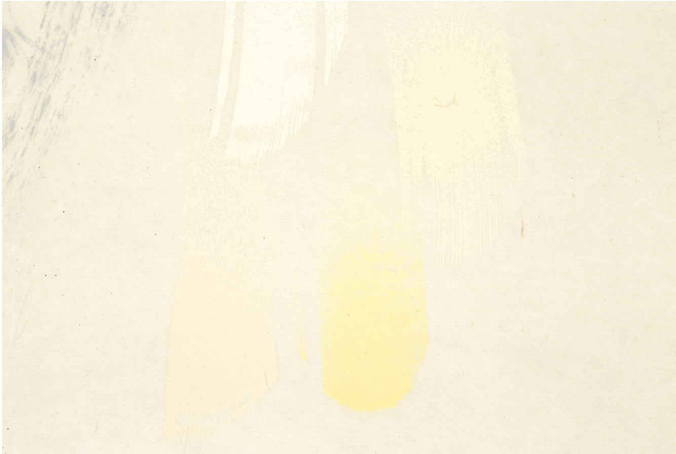
WANDERINGS Teno-fjellene. The Paths are Harsh, Black, Scarlet and Airy... (Detailj)