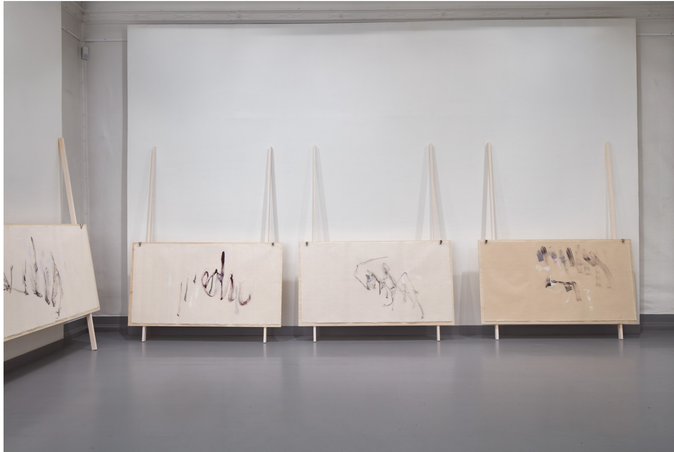
Laurisilva : Penseltegning /olje på Seichosen Kozo 73cm x 140cm. Montert på bjørkeplater.