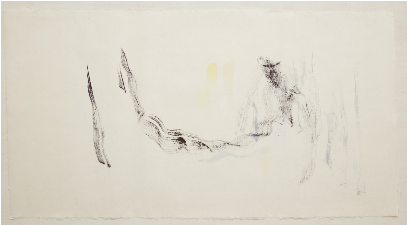
WANDERINGS Teno-fjellene. The Paths are Harsh, Black, Scarlet and Airy... Penseltegning/olje på Seichosen Kozo/Mitsumata 73cm x 140 cm