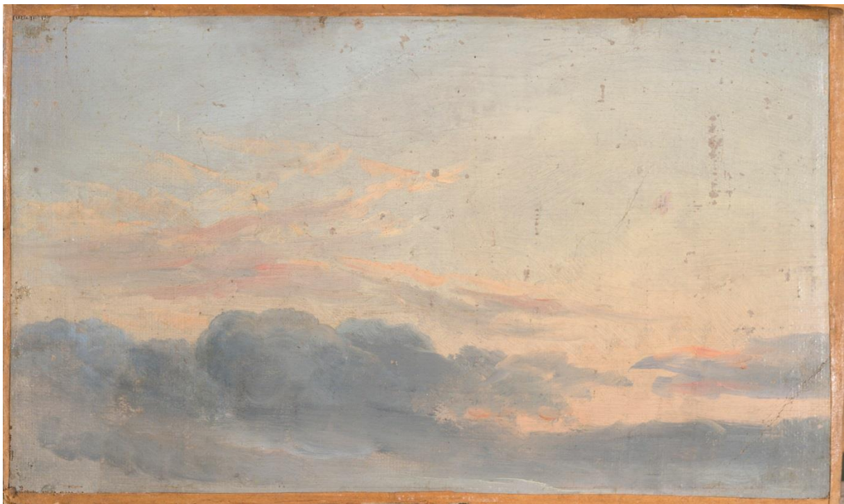
J. C. Dahl, Skystudie , udatert. KODE.

Vi ønskjer også å tilby dei andre ansatte i formidlingsavdelinga og våre eksterne kursing og opplæring i ha omvisingar for personar med demens.