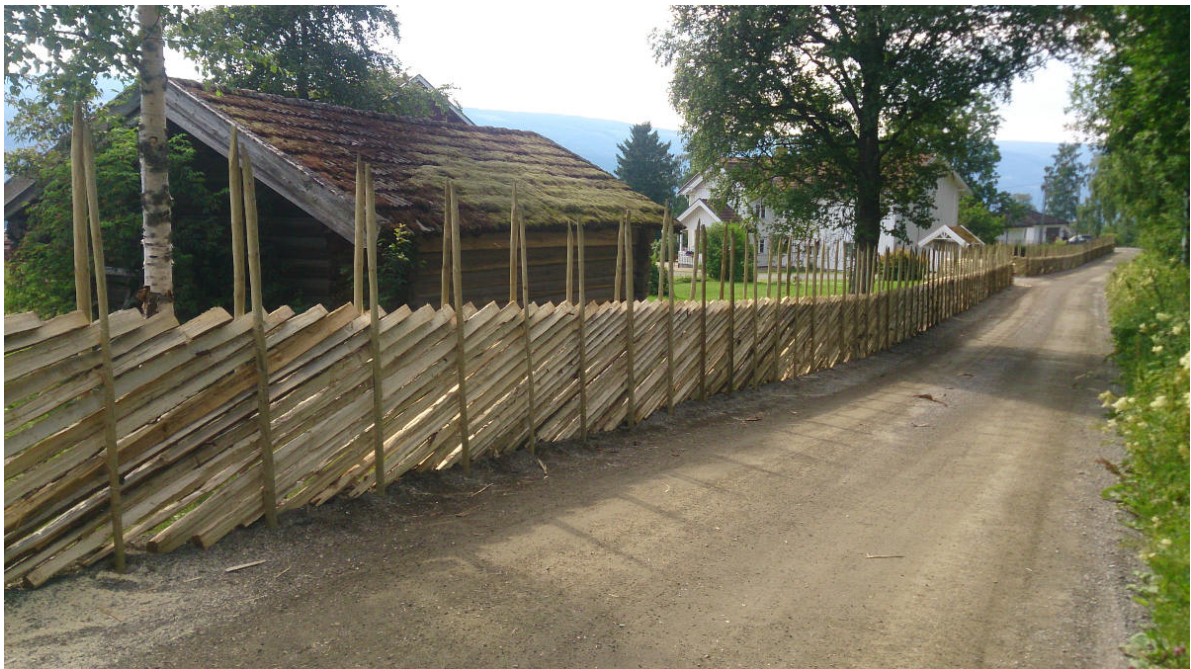
Bilde 4: Skigard. Det nasjonalromantiske gjerdet.