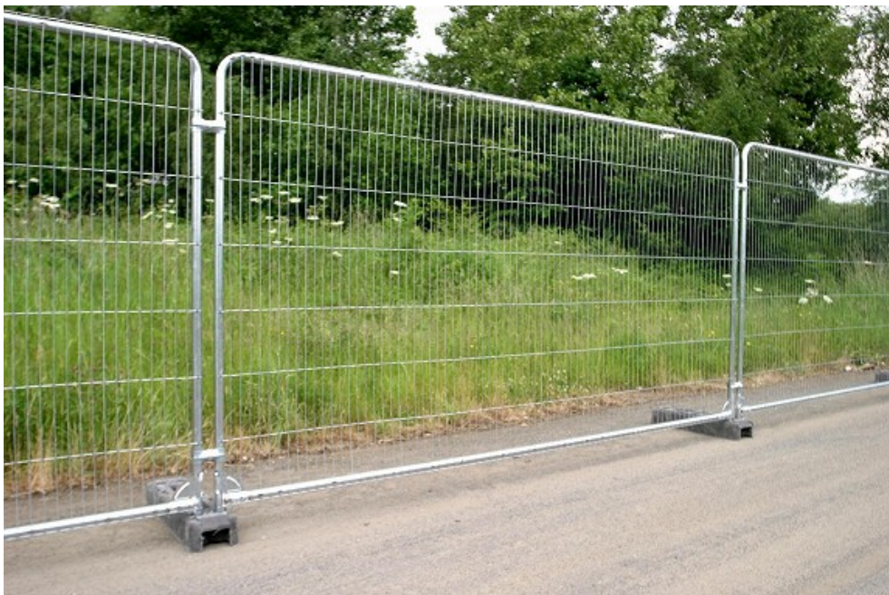
Bilde 2: Festivalgjerde. For å skille de som har betalt og de som ikke har betalt.