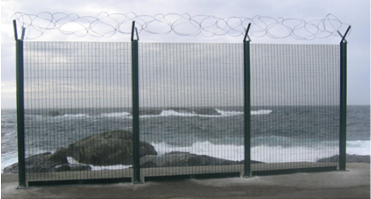
Bilde 3: "Terrorgjerde" (tittel hentet fra leverandør).