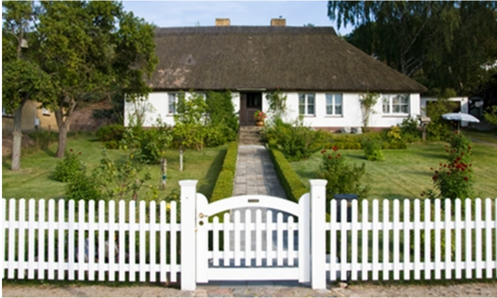
Bilde 1: Stakittgjerde, for å ramme inn hus og områder.