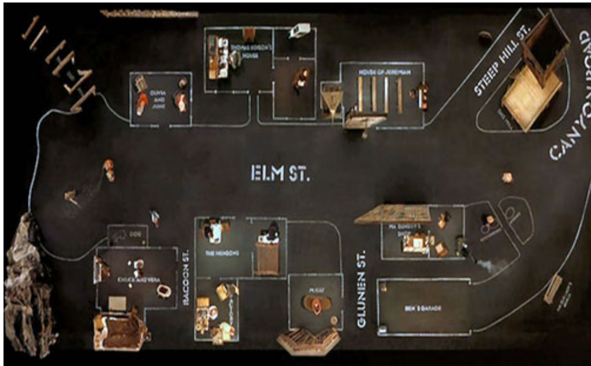
Bilde 5: "Dogville" av Lars von Trier. Hva er det minste man trenger for å lage avgrensinger? Man trenger ikke å få alt inn med teskje.

M.I.A - Paper planes : "All I wanna do is **** and take your money".