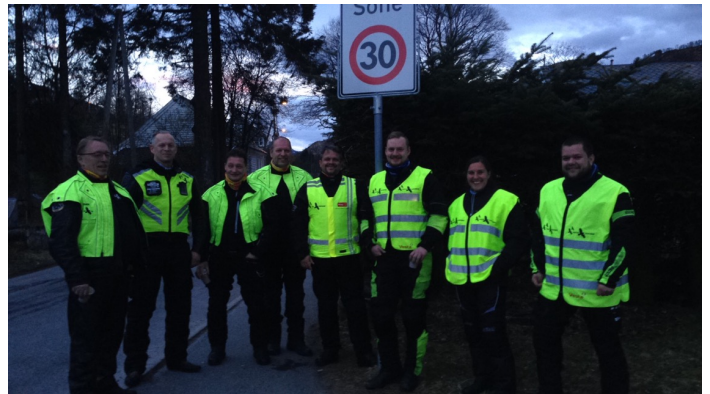
“Motersykkelnatteravnene” på plass i Arna

Vi ble kontaktet av Arna og Åsane kulturkontor i januar, da de ønsket å engasjere UFLAKKS som arrangør for en konsert under Kulturdagene i Arna i april. Konserten skulle bestå av 2 artister UFLAKKS booket, samt 6 artister som var med i kulturkontorets utvekslingsprogram med Haugesund.