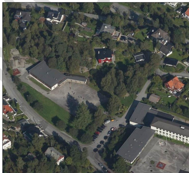
Skråfoto som viser dagens situasjon.

Store deler av området er planert ut og asfaltert. Området i sør og øst er opparbeidet med plen og flere trær. Nord for bygget som står der i dag ligger en liten kolle med furu og bjørk. Denne kollen har stor verdi som naturlig lekeområde for elever ved Eidsvåg skole. Vest for bygget er det et område med flere ulike lekeapparater.