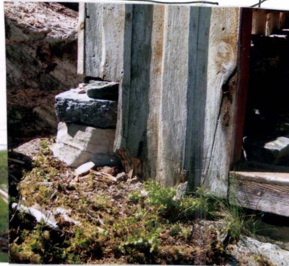
STAV BØ HJØRNE/MUR