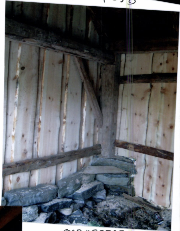
SYD VESTRE HJØRNE NY KLØDNING