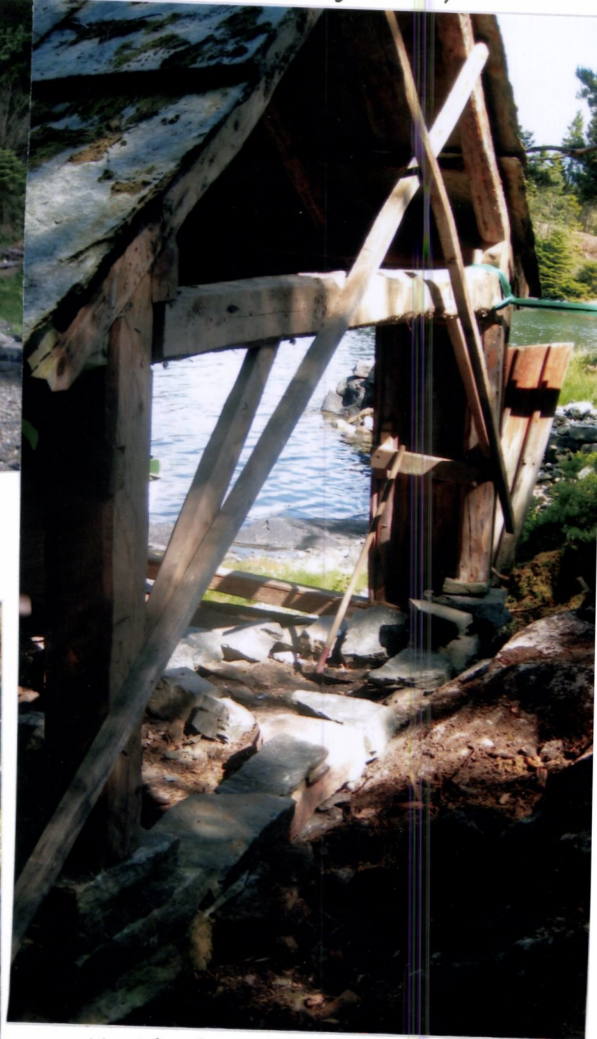
NY MUR FOR GAVLVEOM S