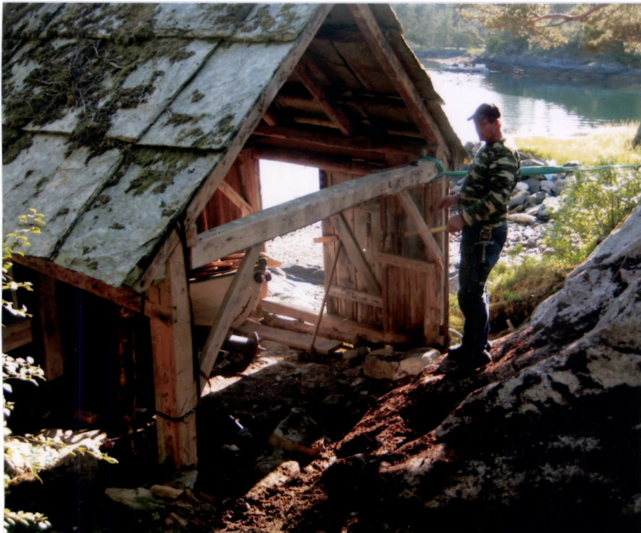
RENSING LØS MASSER. SIKRING GRINØVERKSYD