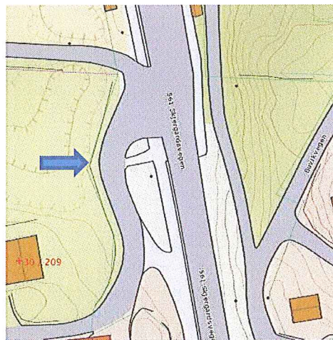
Kart over dagens avkjørsel

Det stilles spørsmålstegn ved om denne vegarmen ikke er en del av den offentlige vegen på bnr. 357, og at avkjørselen som vises i reguleringsplanen derfor faktisk er en « avkjørsle frå offentlig veg ». I så fall kommer ikke vegloven § 40 til anvendelse for saken i Hushaugen.