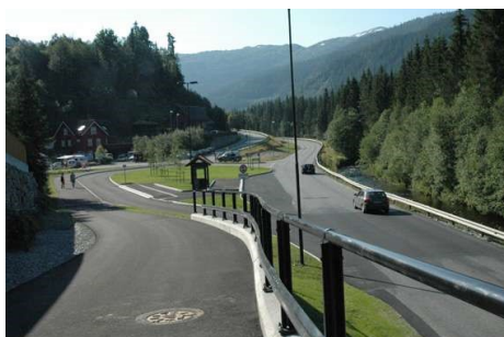
Viser gang- og sykkelveg til ny busstopp ved Rv. 13

På vestsida av elva har det vore gjort justeringar på gang og sykkelvegen (tidlegare jernbanetrase), slik at ein har vunne nok høgde for å få knyta seg til ei bru over elva og Rv. 13. På austsida av Rv. 13, frå den nye gangbrua og ned til busstoppen er det laga ny gang- og sykkelveg. I samband med dette vart det også laga ein veg frå gangbrua opp til Tymbrålsbakkane som erstatning for tidlegare tilkomst til Tymbrålsbakkane. Denne gangvegen er kommunal, men ikkje klassifisert som gangveg.