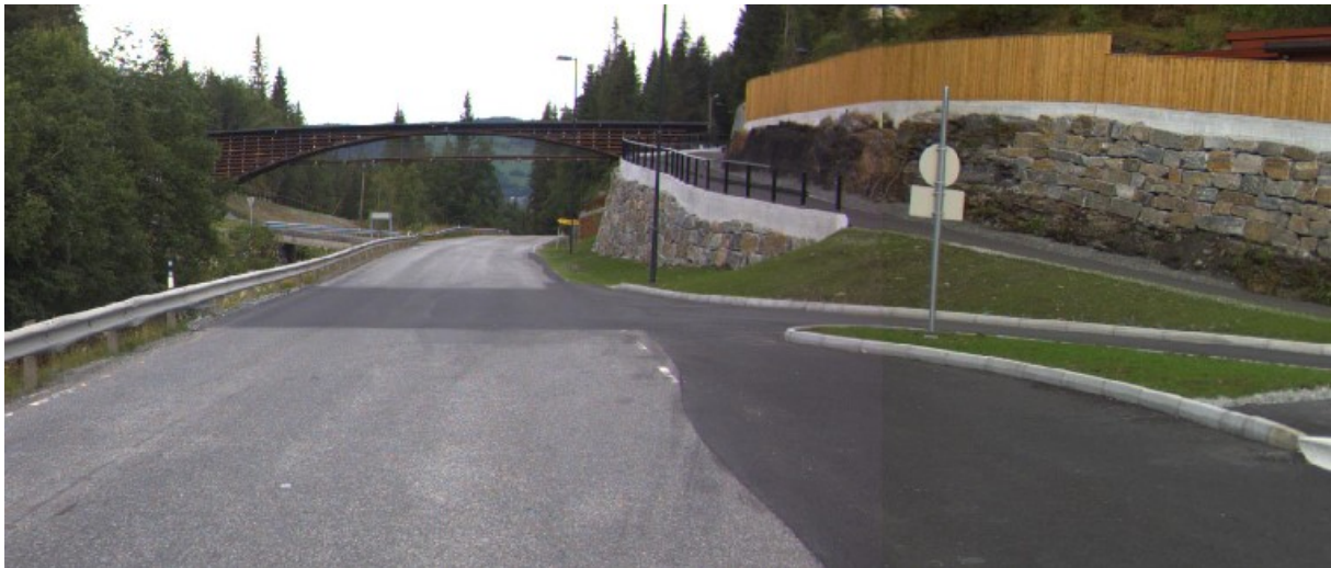
Viser ny planfri gang- og sykkelbru/veg over Rv. 13 og ned til busstopp

I samband med at det er bygd ny trygg planfri gang- og sykkelveg/bru til busstopp over Rv. 13 ved Bjørgum har Statens vegvesen føreteke ein del endringar på eksisterande gang- og sykkelvegssystem.