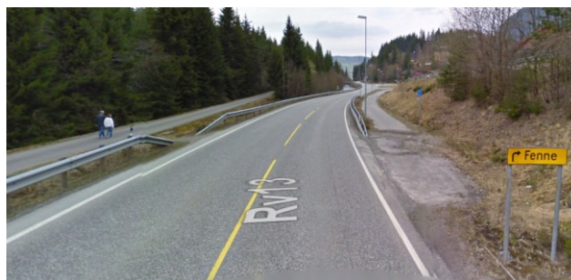
Viser gamal kryssing av Rv. 13 som nå er fjerna