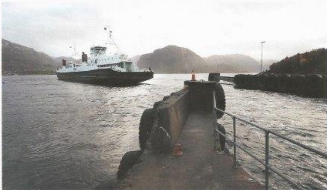
I dag går Nofed-ferja MF «Finney» i rute over Høgsfjorden mellom Lauvik og Gausel. BIL FOTOFOTO: Tor Inge Jessberg