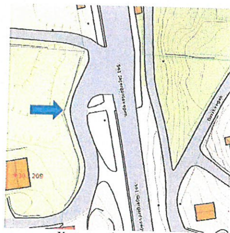
Kart over dagens avkjørsel

Det stilles spørsmålstegn ved om denne vegarmen ikke er en del av den offentlige vegen på bnr. 357, og at avkjørselen som vises i reguleringsplanen derfor faktisk er en « avkjørsle fra offentlig veg ». I så fall kommer ikke vegloven § 40 til anvendelse for saken i Hushaugen.