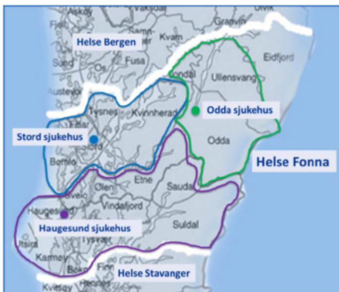
Figur 4. Sjukehusområdet i Helse Fonna

Prosjektrapporten omtalar ulike karakteristika ved sjukehuset. Stord sjukehus er eit akuttsjukehus som skal gje eit tilbod til dei store pasientgruppene i området. Det er medisinske og kirurgisk sengepostar og poliklinikkar ved sjukehuset i tillegg til operasjonsavdeling med fire operasjonsstover. Sjukehuset dekkjer ein befolkning på 49 000 som er forventa å stige til 56000 i 2030, og då særleg innan gruppa eldre. Kommunane i Sunnhordland har i dag fleire akutttinnleggingar enn vanleg gjennomsnitt pr. 1000 innbyggjarar.