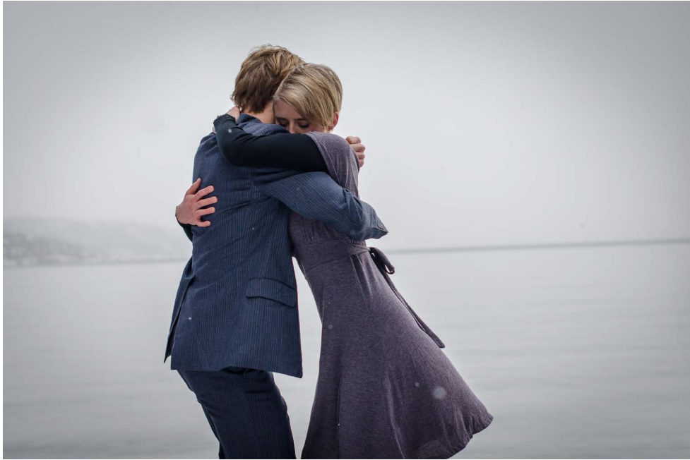
Bilete henta frå dansefilmen “Saman og åleina”.

Ei satsing som «Folkedans i Hordaland» bidrar til synergieffektar. Dans er kultur, men også kroppsleg, fysisk og mental fostring, og har derav også helsebringande effektar. I tillegg til at ei satsing på tradisjonsdansen vil bidra til positive helsebringande effektar, vil den også ha positiv innverknad på sosial og kulturell interaksjon.