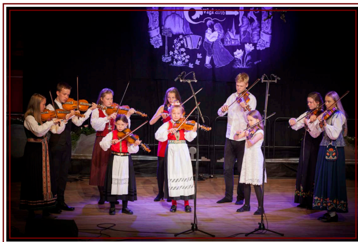
Bergen juniorspelemannslag i aksjon under Landskappleiken 2016, der dei vann sin klasse.