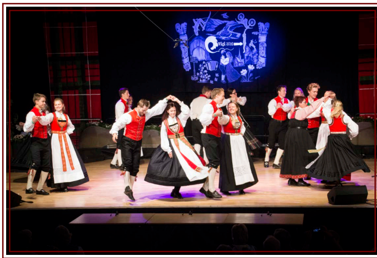
Hardanger Spelemannslag tevlar i lagdans under Landskappleiken 2016.

Formålet med ei satsing på folkedans i Hordaland er å leggja til rette for gode vekst- vilkår, auka interesse og forståing for tradisjonsdansen. Hovudprosjektet vil vera med å bidra til eit løft og bygga opp miljøa og aktiviteten i fylket. Det skal også bidra til å gjera folkedansen frå Hordaland meir synleg for innbyggjarane i fylket, men også på nasjonalt