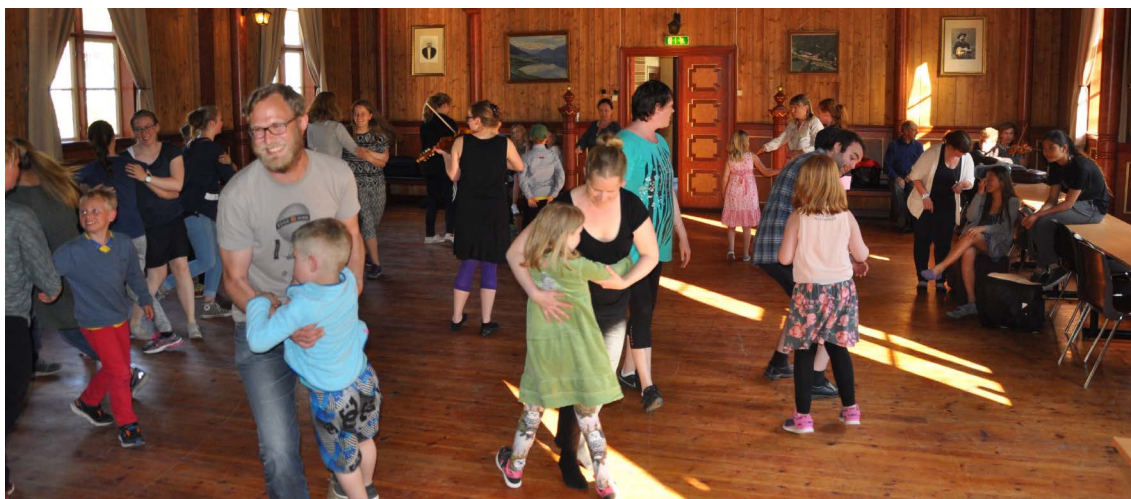
Glade dansarar under kveldssamling for born og unge i Granvin.

Det er også ein del samarbeid mellom dei ulike kulturskulane rundt omkring i Hordaland. Dette er enten samarbeid om lærarressursar, tilbod og/ eller prosjekt. Desse alle-reie eksisterande samarbeida lyt ein ta omsyn til, og nytta seg av i eit vidare samarbeid med også fleire kulturskular.