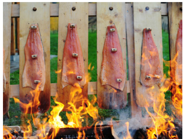
Bilete frå nettsida til Hardangermeny

Med bakgrunn i eit kartleggingsarbeid i høve produsentane sine behov er målet med forprosjektet å utarbeida ein fullstendig forretningsplan for ein driftsorganisasjon.