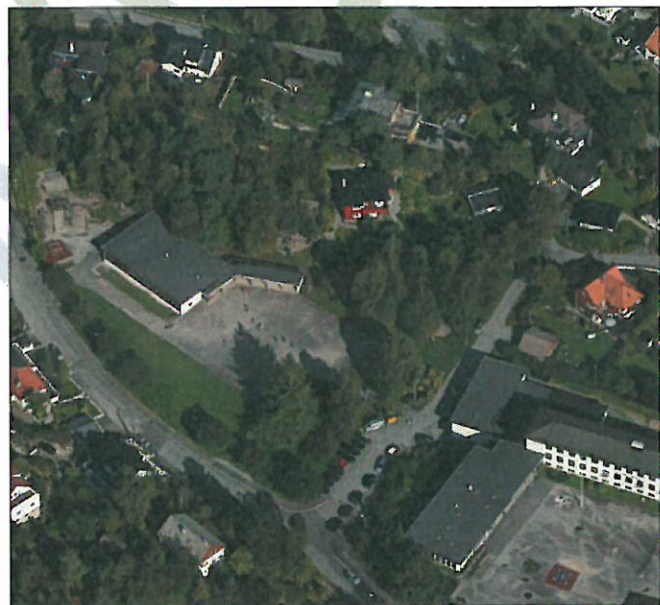
Skråfoto som viser dagens situasjon.

Store deler av området er planert ut og asfaltert. Området i sør og øst er opparbeidet med plen og flere trær. Nord for bygget som står der i dag ligger en liten kolle med furu og bjørk. Denne kollen har stor verdi som naturlig lekeområde for elever ved Eidsvåg skole. Vest for bygget er det et område med flere ulike lekeapparater.