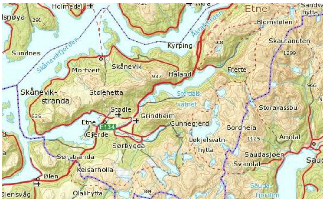
Figur 1 Oversiktskart

Fylkeskommunen har særleg ansvar for kulturminne og som vassregionmyndigheit.