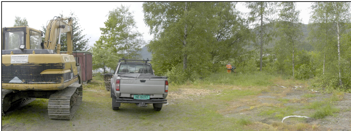
Olahaugen og del av området rundt.

Utfylt EXCEL-skjema er sendt per epost. Merk at Munketrappene i opprinneleg BARK-liste av 2012 ikkje er ført på eit ID-nr i høve til Askeladden. Dette er retta opp i det elektroniske søknadsskjemaet.