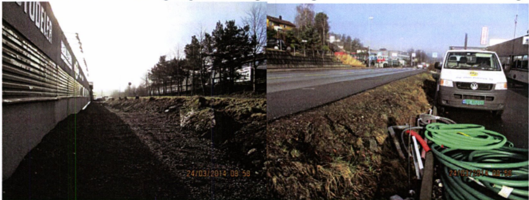
Bilde1 – Dagens område på sørside av bygg fortau/vegbane

lvaretar laster fra fortau og vegbane i langt større grad en slik det fremkommer i dag.