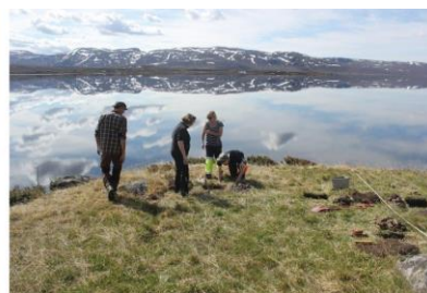
Gratangen, foto Arve Kjersheim. Halden, foto Guri Dahl. Vinstervann, foto Kristine Johansen. Alle Riksantikvaren