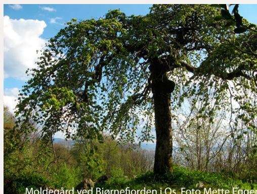
Moldégård ved Bjørnefjorden i Os.

Riksantikvarens Utviklingsnett er et kompetansetilbud som tar opp aktuelle kulturminnefaglige emner. Det skjer gjennom ulike typer seminarer, både dagsseminarer som arrangeres rundt om i landet og seminarer som går mer i dybden. Tilbudet er gratis og åpent for alle interesserte, men emnene er i hovedsak vinklet mot problemstillinger og utfordringer i kommuner og lokalsamfunn. Seminarene er også en viktig møteplass for kulturminneforvaltningen på alle nivå og andre fagmiljøer og samfunnssektorer. Program for arrangementene legges fortløpende ut på Riksantikvarens nettsider og sendes ut til kontakter over hele landet.