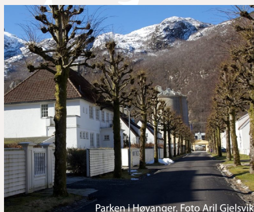
Parken i Høyanger.