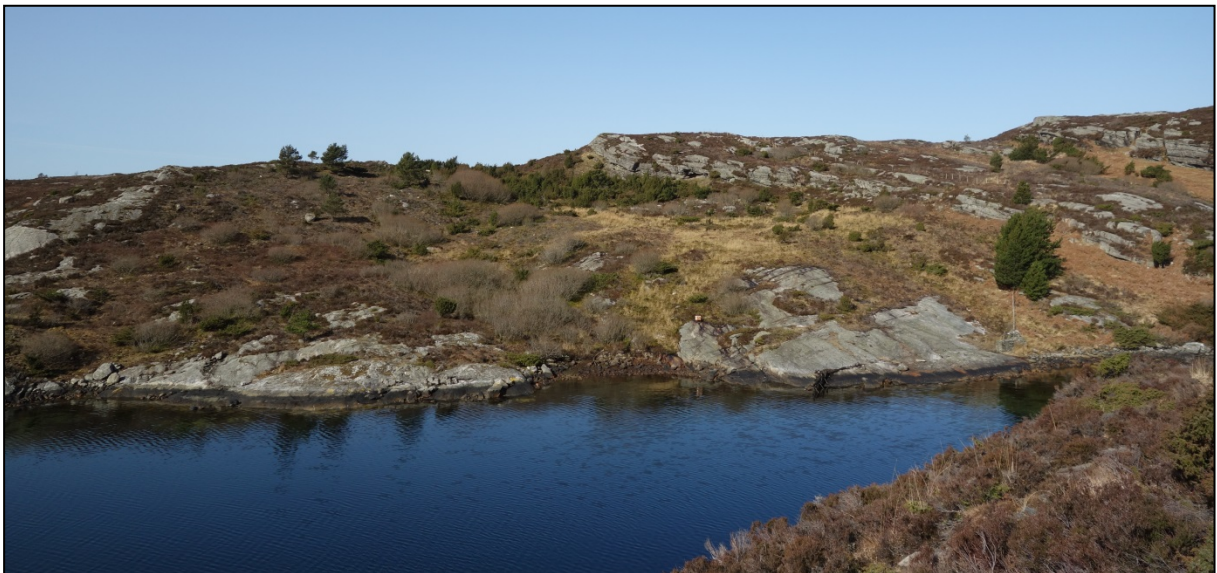
Utsyn mot Høybøen.

området, blei dei fascinert over mengda av ulike kulturminne og tidsspennet desse kunne vise til. Dei framheva også lyngheia i området, som jo er eit resultat av bruk av området. Når det gjaldt målgrupper så var dei meir opptekne av å formidle området til dei som bur i nærleiken, enn til tilreisande. Dei ville formidle på ein slik måte at folk ynskjer å stoppe mogleg industrialisering nord for Høybøen, og bevare området for framtida. Studentane var også opptekne av at ein må unngå skiltjungel i området. Dei hadde nytta seg av digitale media, og viste til ein QR-generator der dei hadde lagt inn stillbileter med forteljarstemme til. Dette fungerte veldig fint, og er til inspirasjon i det vidare formidlingsarbeidet.