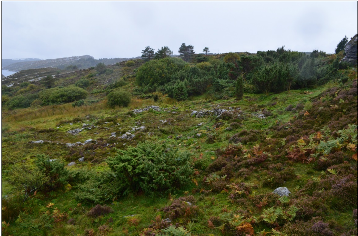
Øydegardsområdet ved Høybøen etter rydding.

Prosjektet ved Høybøen er delt i to fasar. Det blei i fjor levert rapport for fase 1 (søknads-ID 2014/1022). Gjeldande rapport er for fase 2 (søknads-ID 2015/8551).