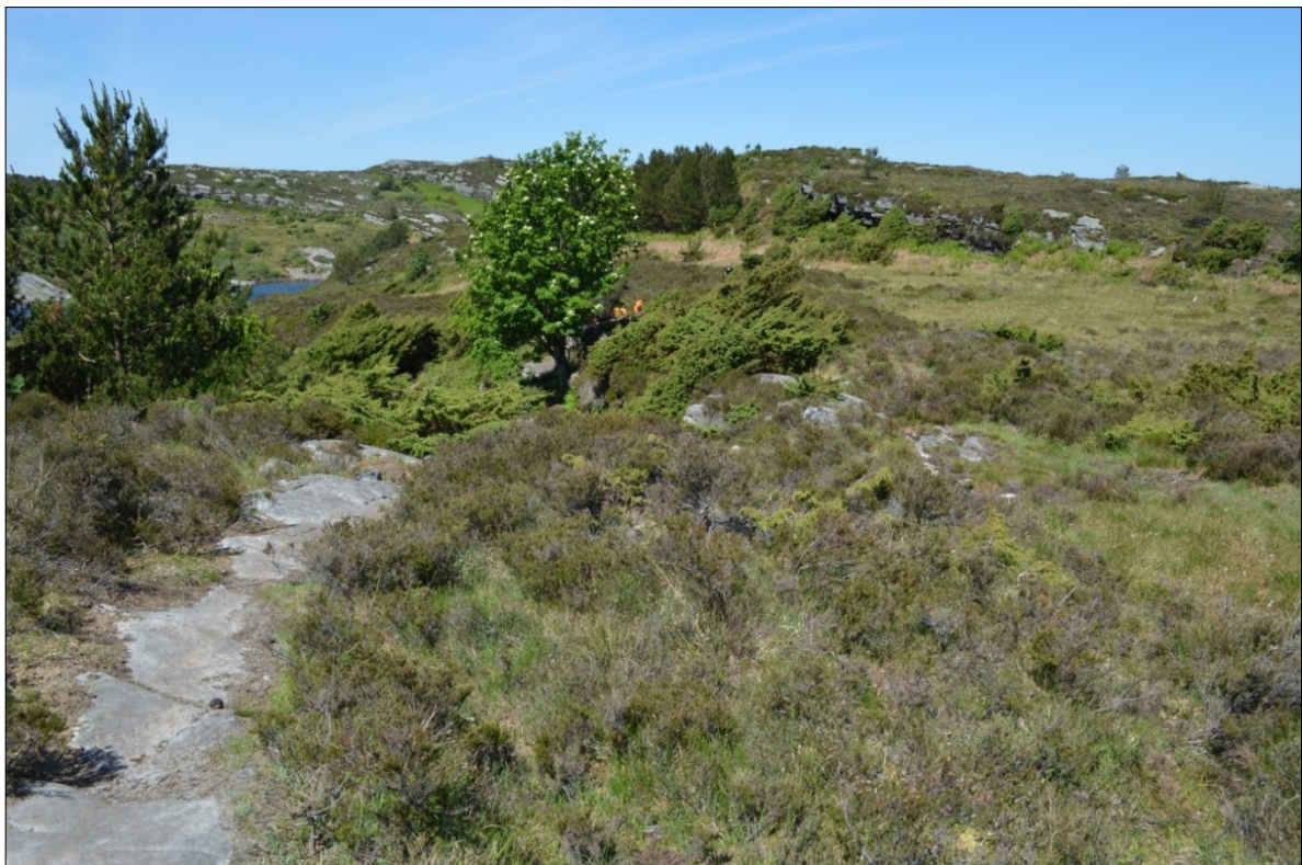
Aust for Kåsa ligg fleire steinalderlokalitetar nært opptil eller i turstien.

Vindenes velforening har lenge ynskt å gå i gang med tilrettelegging av turstiane i området. Turlaga i området, Fjell turlag og Sotra og Øygarden turlag, har også sagt at dei er villege til å gjere ein innsats. Fjell kommune vil, saman med dei nemnte laga, utforme eit opplegg for tilrettelegging av turstiane. Fleire av partia ber preg av at dei ligg i våtlendt terreng, slik at ei omlegging av stien til tørrare brinkar vil vere ein fordel der det er mogleg. I andre områder bør ein bygge kloppar og/eller gangbruer. I prosessen med tilrettelegging må ein også ta omsyn til ferdsel for småfe og storfe. I myrpartiet som ein ser foran buskene på biletet nedanfor, søraust for Høybøen, er det eit lengre strekk med funn av fleire steinalderlokalitetar. Nokre av desse er sårbare i forhold til ferdsel, og Hordaland fylkeskommune vurderer no ulike former for tiltak i dette området. Fjell kommune ser elles nærmare på tiltak i forhold til at nokon nyttar ATV i delar av turløypa.