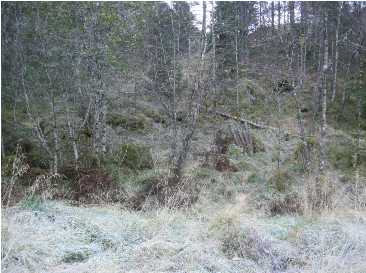
Bilde tatt i stasjonstomten og oppover rørgaten