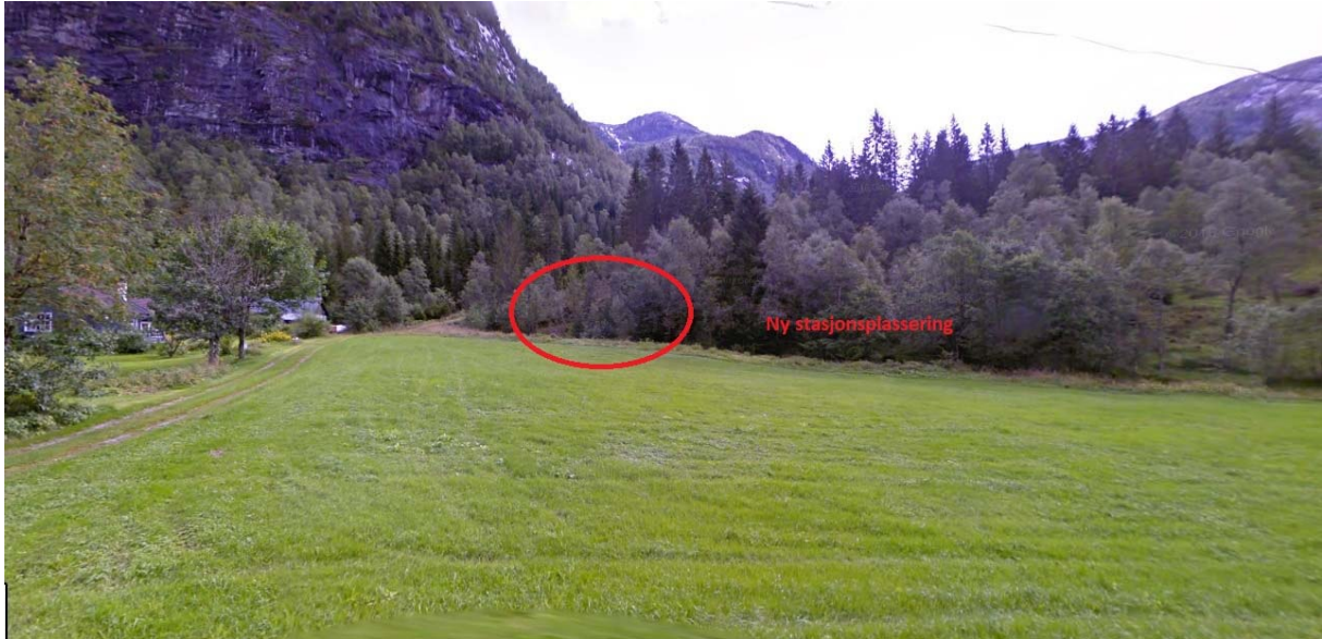
Bilde viser ny plassering av kraftstasjon.