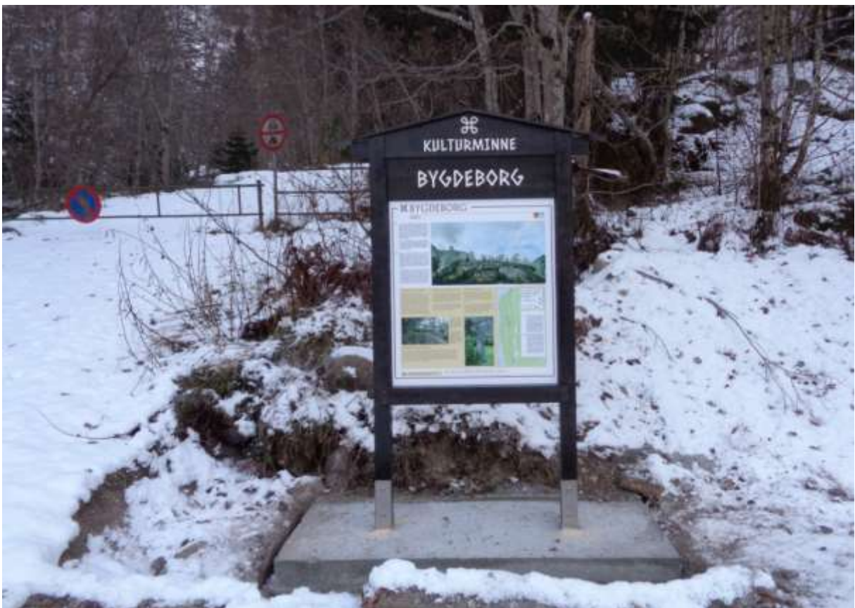
Skiltet ved parkeringsplassen. Betongplattformen blir gravd ned, slik at skiltet er tilgjengelig fra rullestol..