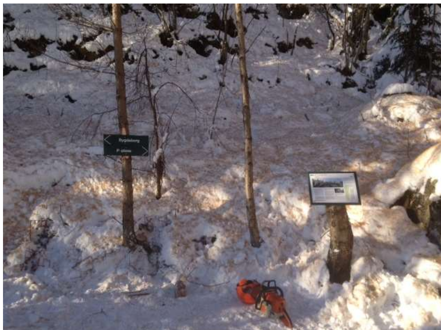
Pilskiltene og infotavlen lengst sør på stien (der traktorvei møter sti)