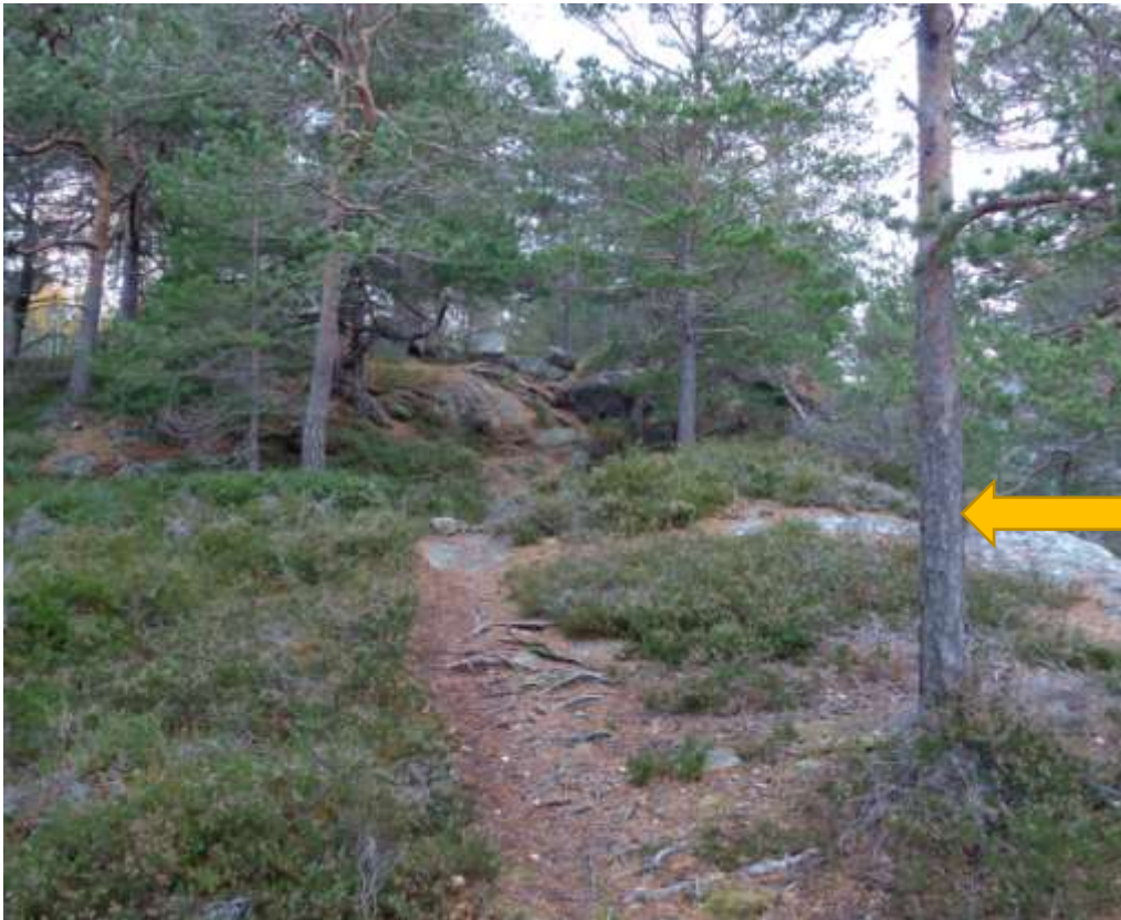
Gul pil viser treet som er kappet og infotavle er montert på