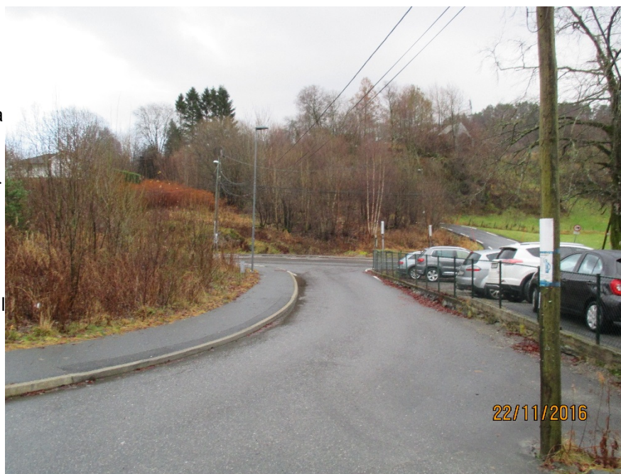
Avkøyrsla frå Repelen til Grimseidvegen sett frå utkøyrsla

Biletet under er henta frå Google Streetview. Det syner Grimseidvegen sett frå vest/Skeievegen.