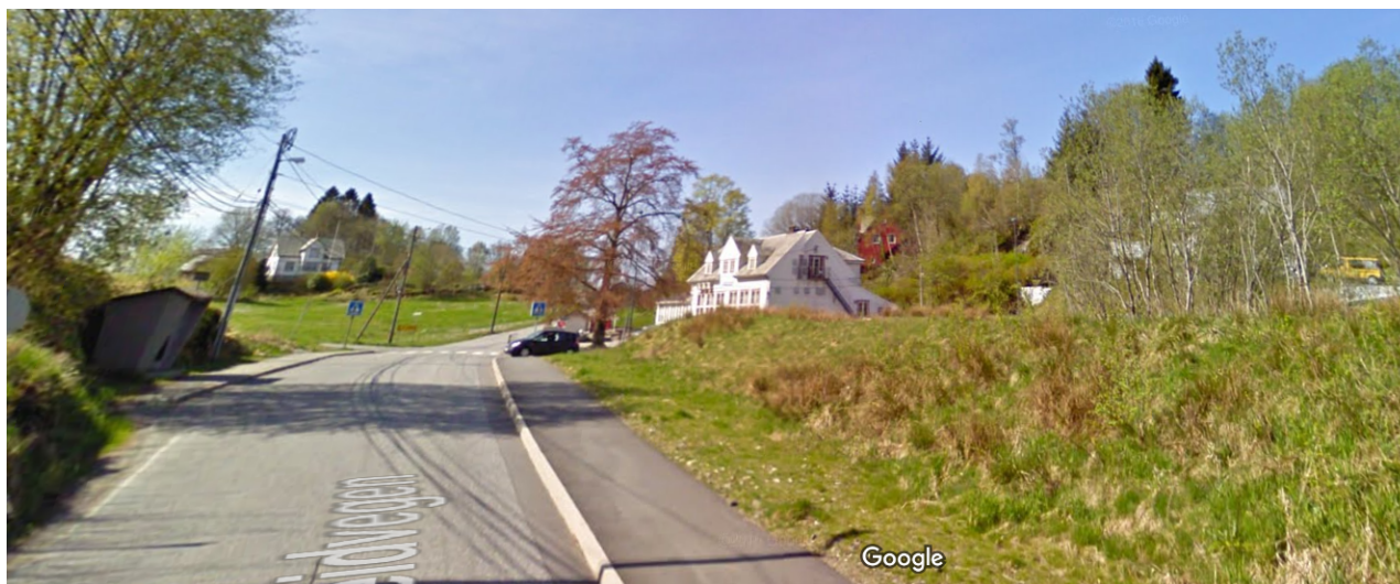
Grimseidvegen ved Repelen, sett frå aust.

Ved hjelp av Google Streetview kan ein også sjå korleis utkøyrsla tek seg ut frå aust: