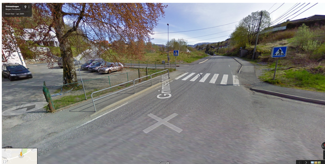
Grimseidvegen ved Repelen, sett frå vest.